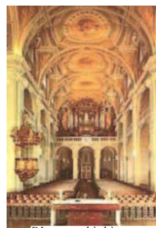
Bên trong nhà thờ