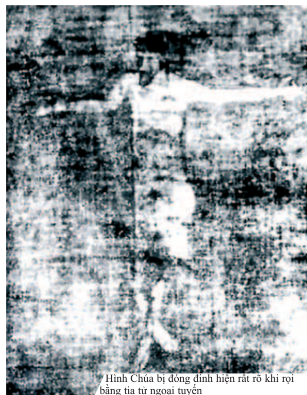
Hình Chúa bị đóng đinh hiện rất rõ khi rọi bằng tia từ ngoại tuyến

Đức Tổng Giám Mục của Mainz là Franz Lothar Von Schonborn, đã xây nên vương cung thánh đường trong khoảng năm 1698-1728. Đến năm 1962, Đức Giáo hoàng Gioan 23 đã nâng nhà thờ lên hàng Tiểu Vương Cung Thánh Đường. Kể từ năm 1938 cho đến bây giờ, các tu sĩ dòng Augustinô vẫn còn chăm sóc nơi này.