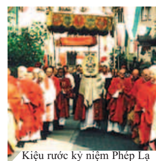
Kiệu rước kỷ niệm Phép Lạ