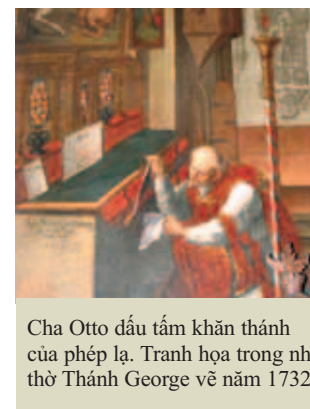
Cha Otto dẫu tấm khăn thánh của phép lạ. Tranh họa trong nhà thờ Thánh George vẽ năm 1732