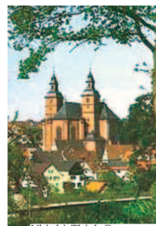
Nhà thờ Thánh George