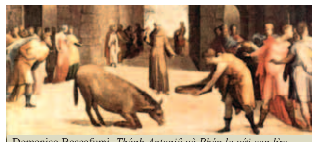
Domenico Beccafumi, Thánh Antoniô và Phép lạ với con lừa (1537) Louvre, Paris