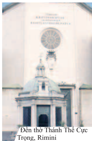
Đền thờ Thánh Thể Cực Trọng, Rimini