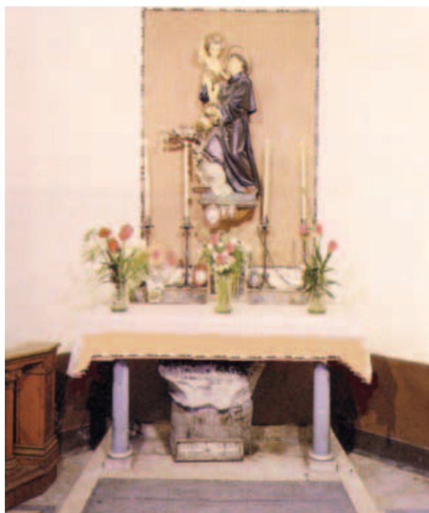
Bàn thờ dựng trên thân cột đá, nơi Thánh Antoniô làm phép lạ