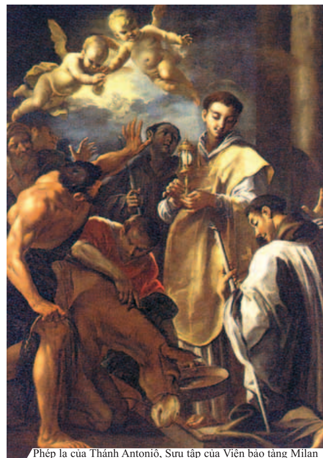
Phép lạ của Thánh Antoniô, Sưu tập của Viện bảo tàng Milan