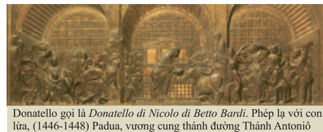
Donatello gọi là Donatello di Nicolo di Betto Bardi. Phép lạ với con lừa, (1446-1448) Padua, vương cung thánh đường Thánh Antoniô