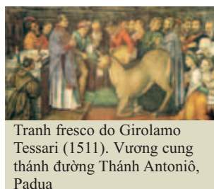
Tranh fresco do Girolamo Tessari (1511). Vương cung thánh đường Thánh Antoniô, Padua