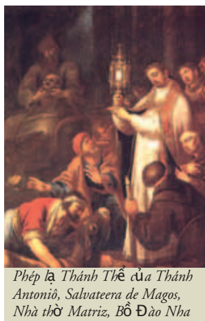
Phép lạ Thánh Thể của Thánh Antoniô, Salvateerra de Magos, Nhà thờ Matriz, Bồ Đào Nha