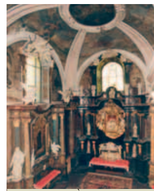
Nhà nguyện đầu tiên nơi Thánh thể phép lạ được lưu giữ cho đến thế kỷ vừa qua