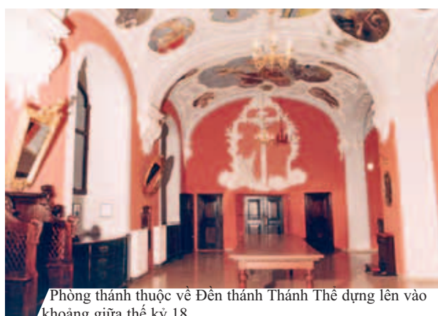
Phòng thánh thuộc về Đền thánh Thánh Thể dựng lên vào khoảng giữa thế kỷ 18