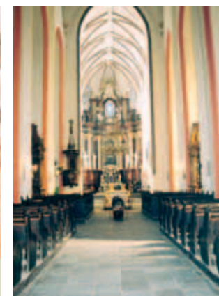
Bên trong đền thánh