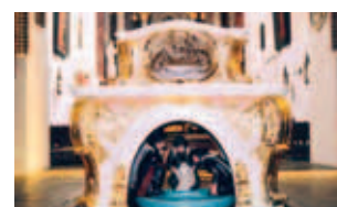
Ngay giữa cung thánh, nằm bên dưới bàn thờ nơi bảo tồn thánh tích Thánh Onufra, có ba tượng ảnh diễn tả ba kẻ phạm thánh cố tìm cách phá hủy Thánh Thể