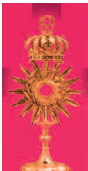
Tại đền thờ Thánh Thể, Mặt nhật quý giá do vua (Wladyslaw) Jagiello dâng tặng, vẫn còn được dùng để tôn trọng Bí tích Cực Thánh