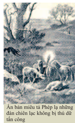
Ấn bản miêu tả Phép lạ những đàn chiên lạc không bị thú dữ tấn công

Cô làm dấu Thánh Giá trước khi tiến vào dòng suối, trong khi cầu nguyện cô thấy nước rẽ ra hai bên một cách kỳ diệu, và ngay cả lúc cô trở về cũng vậy.