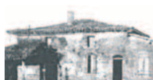
Ngôi nhà của Thánh Germaine đã sô