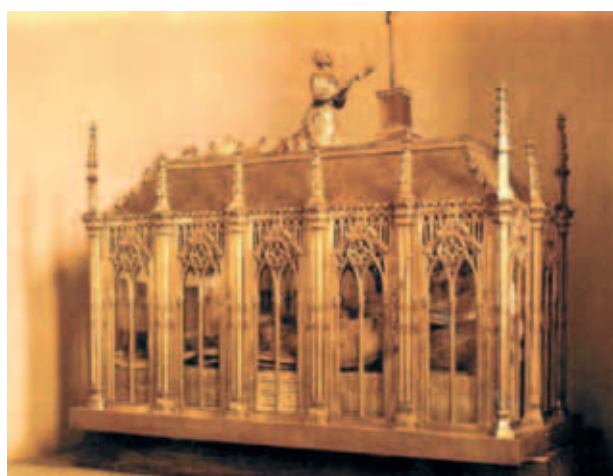
Mộ Thánh Germaine