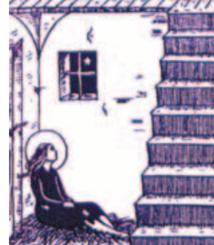
Thánh Germaine bị mẹ kế bắt ở trong gian hầm dưới cầu thang