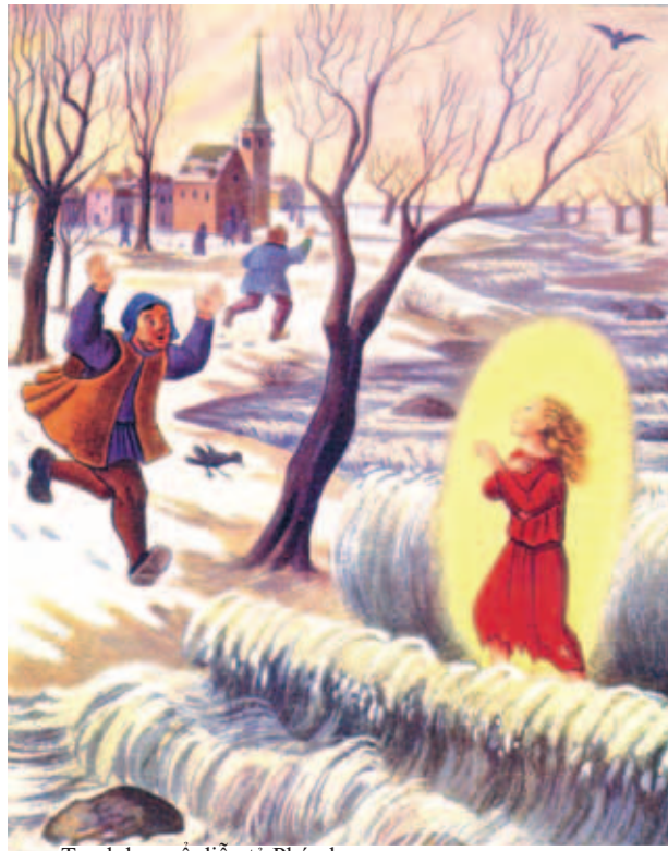
Tranh họa cổ điển tả Phép lạ

Phép Lạ Thánh Thể ở Pibrac có liên quan đến Thánh Germaine Cousin (1579-1601). Thánh nữ phải vượt qua một dòng nước chảy xiết mỗi khi muốn đi dự Thánh Lễ; và dòng nước rẽ đôi để mở đường cho thánh đi qua được dễ dàng.