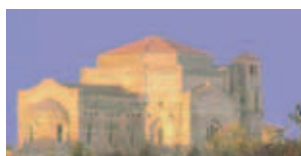
Vương cung thánh đường cung hiến cho Thánh Germaine