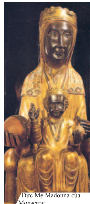
Đức Mẹ Madona của Montserrat