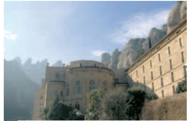
Đền thánh Đức Mẹ Madona của Montserrat