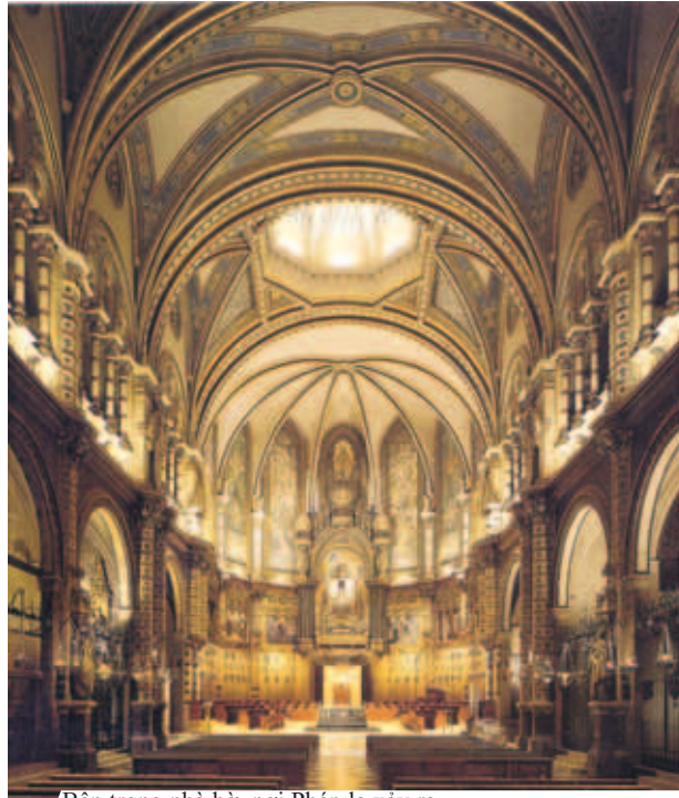
Bên trong nhà thờ, nơi Phép lạ xảy ra