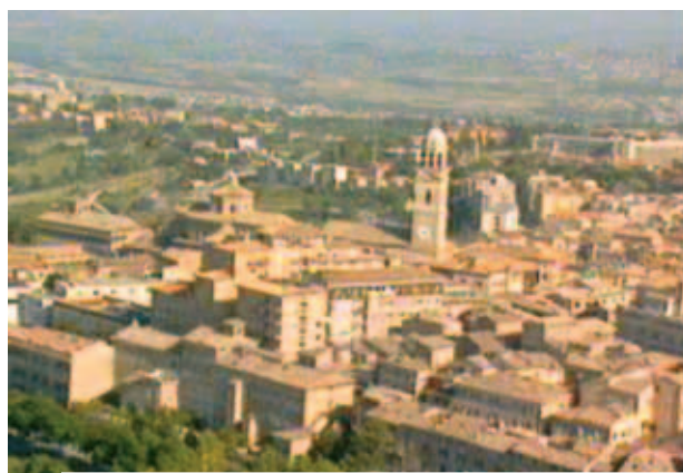
Quang cảnh Macerata