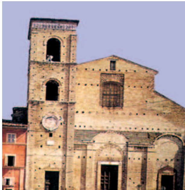
Nhà thờ chính tòa Macerata

Ngày 25 tháng 4 năm 1356 ở Macerata, một linh mục vô danh làm Lễ ở nhà thờ Thánh Catarina do các tu sĩ Dòng Biển Đức cai quản. Đến lúc bẻ Bánh trước khi Hiệp Lễ, linh mục chợt nảy lên ý tưởng hồ nghi đối với Sự Hiện Diện thực sự của Chúa Giêsu trong Hình Bánh. Ngay lúc ấy ngài kinh ngạc thấy Máu tuôn chảy từ Mình Thánh, làm dính cả trên khăn thánh và ly thánh để trên bàn thờ.