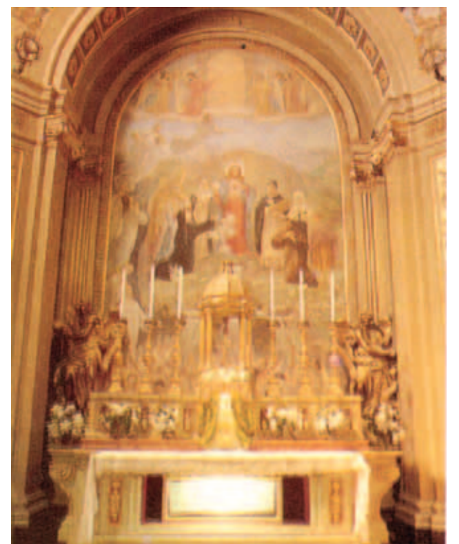
Nhà nguyện Mình Thánh Cự Trọng nơi lưu giữ thánh tích

Năm 1493 một trong những cộng đoàn thờ kính Thánh Thể đầu tiên được lập ra ở Macerata, và cũng chính tại đây 40 Giờ Chầu Phép lành được đặt ra bắt đầu từ 1556. Hàng năm vào ngày lễ Mình Máu Thánh Chúa (Corpus Christi), tấm khăn thánh tích được cung nghinh trọng thể, đi theo sau Bí Tích Cự Thánh.