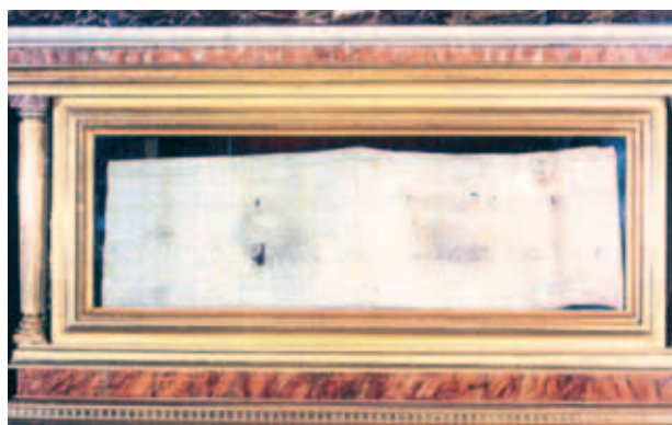
Thánh tích Khăn thánh dính Máu