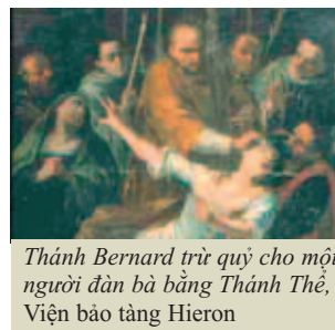
Thánh Bernard trị quỷ cho một người đàn bà bằng Thánh Thể, Viện bảo tàng Hieron