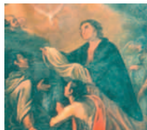
Thánh Secondo trước khi chết, đã rước Lễ do Chim bồ câu mang lại, Viện bảo tàng Hieron