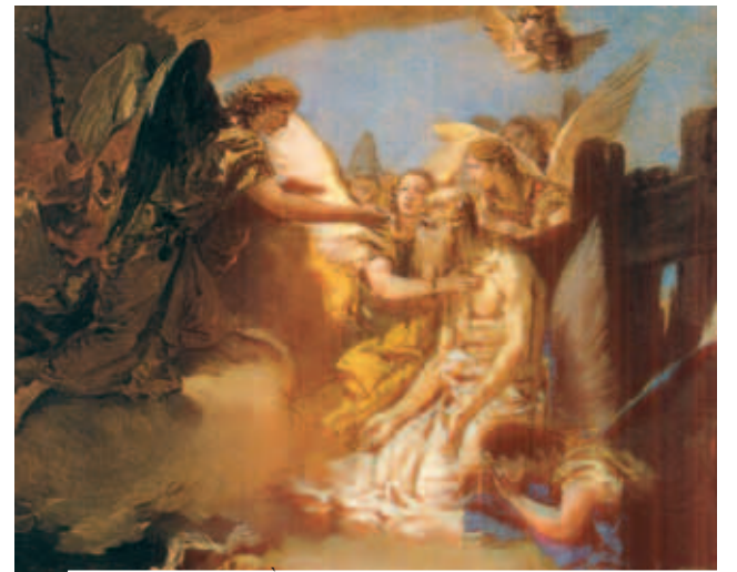
Một trong những mâu nhiệm Các Thánh Thông Công.