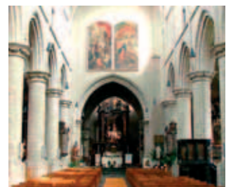
Bên trong nội thất nhà thờ San - Waldertrudis