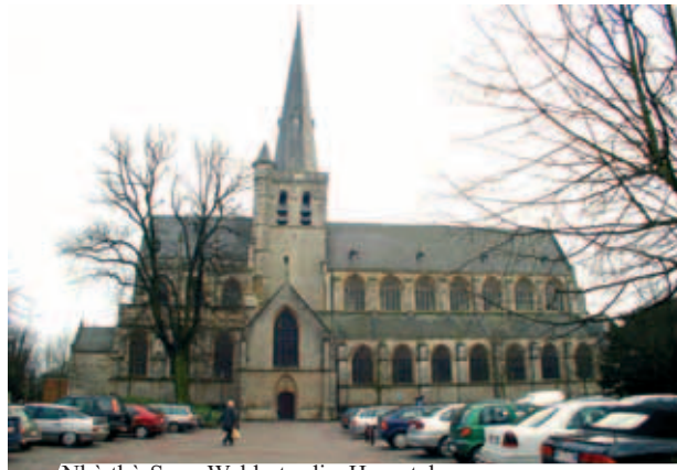
Nhà thờ San -Waldertrudis, Herentals

Trong Phép lạ Thánh Thể Herentals, Thánh Thể bị mất sau tám ngày và vẫn không hư hoại, mặc dù trời mưa. Thánh Thể tìm ra trong hang thỏ vẫn tỏa sáng và sắp hàng thành hình thánh giá. Hàng năm, dân chúng rước kiệu hai bức tranh của họa sĩ Antoon van Ysendyck đã vẽ mô tả Phép lạ, họ đi đến cánh đồng nơi nguyện đường De Hegge được dựng nên. Một Thánh lễ trọng thể được cử hành tại nơi này trước mặt mọi người. Ngày nay, hai tranh họa ấy đang lưu giữ tại đại thánh đường Saint-Waldertrudiskerk ở thành phố Herentals.