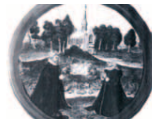
Tranh họa do Van Ysendyck miêu tả Phép lạ