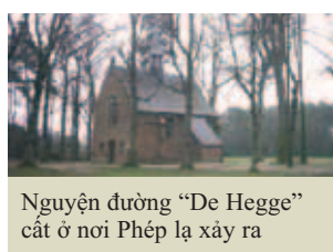
Nguyện đường "De Hegge" cất ở nơi Phép lạ xảy ra