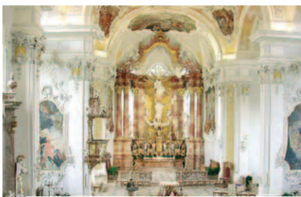
Bên trong nhà thờ