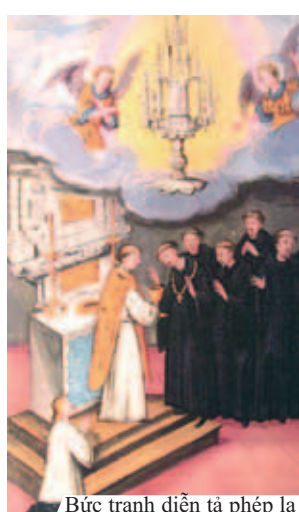
Bức tranh diễn tả phép lạ