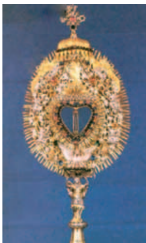
Mặt nhật từ năm 1719 có đựng Máu Cực Châu Báu

Ngôi làng nhỏ trong thung lũng Inn tên là Georgenberg-Fiecht trở nên nổi tiếng từ khi Phép lạ Thánh Thể xảy ra năm 1310. Trong khi dâng Lễ, bỗng dưng trong lòng linh mục trở nên hoài nghi về hiện diện thực sự của Chúa Giêsu trong bánh rượu đã thánh hiến. Ngay trong giây phút truyền phép, rượu biến thành Máu rồi bắt đầu sôi sục, từ trong lòng ly thánh chảy tràn ra ngoài. Năm 1480, 170 năm sau, Máu Thánh vẫn còn “tươi mới như vừa chảy ra từ vết thương” và vẫn còn nguyên cho tới bây giờ, lưu giữ trong Tu viện thánh Georgenberg.