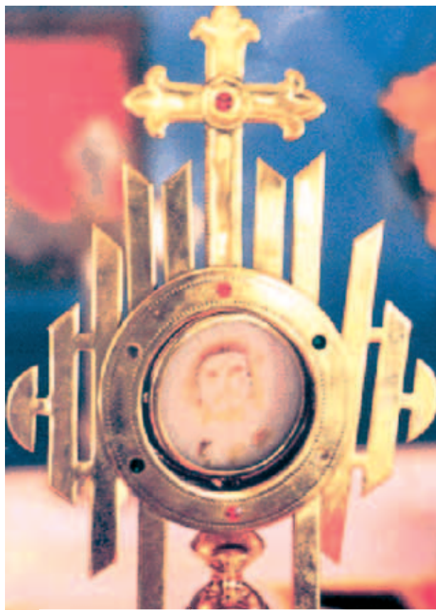
Mặt nhật giữ Thánh Thể Chúa đã hiện ra