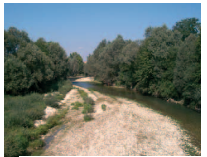
Dòng sông Maira

Canosio là một ngôi làng nhỏ nằm trong vùng Maira, thuộc giáo phận Saluzzo. Vào năm 1630, đức tin của dân làng đang bắt đầu xuống dốc vì ảnh hưởng của dị giáo Calvinist. Sau ngày lễ Minh Máu Thánh Chúa, mưa như thác đổ xuống không dứt, làm sông Maira bị ngập lụt. Nước lụt dâng lên mạnh đến nỗi những tảng đá lớn trên núi cũng bị cuốn trôi đi. Xem ra ngôi làng nhỏ bé nằm trong thung lũng không tránh khỏi nguy cơ bị tàn phá bởi dòng nước lũ.