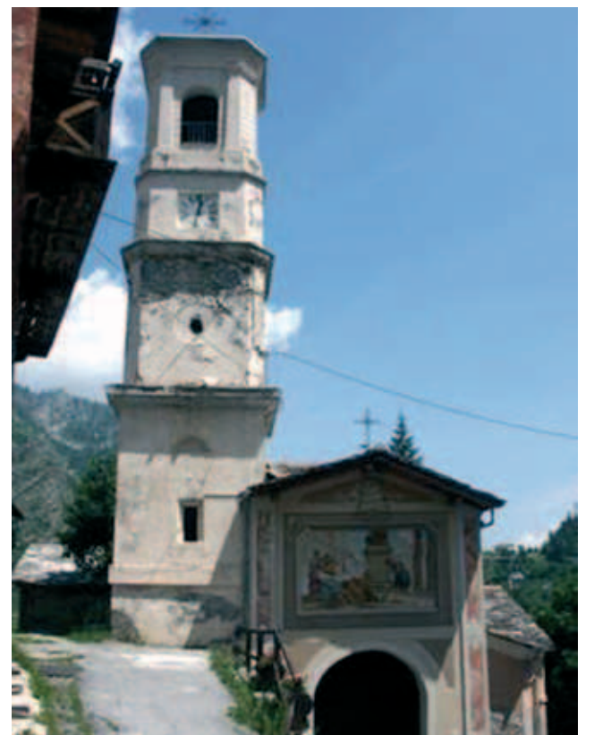
Nhà thờ giáo xứ Canosio