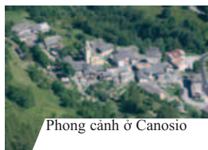
Phong cảnh ở Canosio