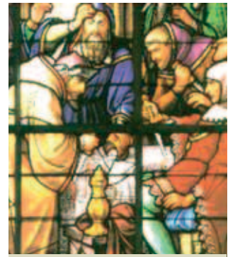
Kính màu trong vương cung thánh đường Thánh Gudala và Thánh Michael, miêu tả về phép lạ