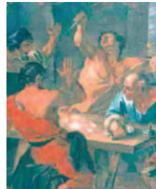
Phép lạ Thánh Thể ở Brussels. Viện bảo tàng Hieron, Paray-le-Monial