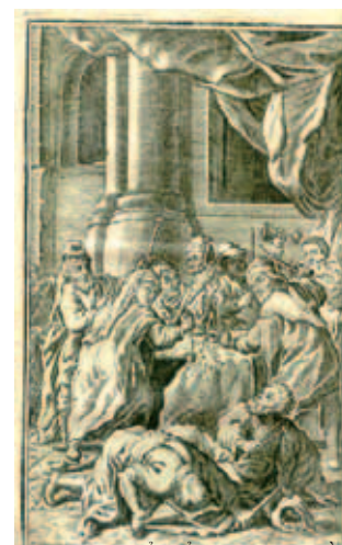
Tranh gỗ điển minh họa về phép lạ