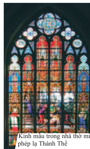
Kính màu trong nhà thờ miêu tả những sự kiện liên quan đến phép lạ Thánh Thể