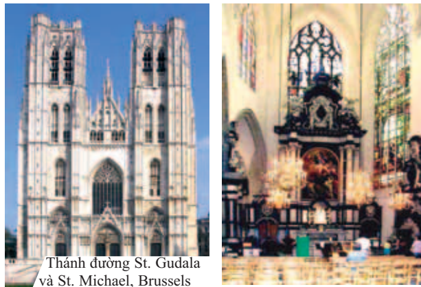
Thánh đường St. Gudala và St. Michael, Brussels