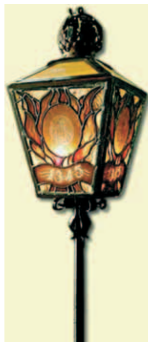
Cây đèn miêu tả Bí Tích Cực Thánh trong dịp rước kiệu kỷ niệm "Stille Omgang" đầu tiên