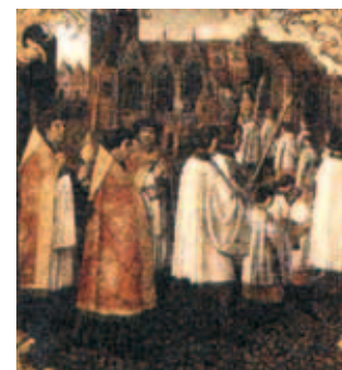
Tranh họa cô điển tả cuộc kiệu trong thể kỷ niệm Phép lạ