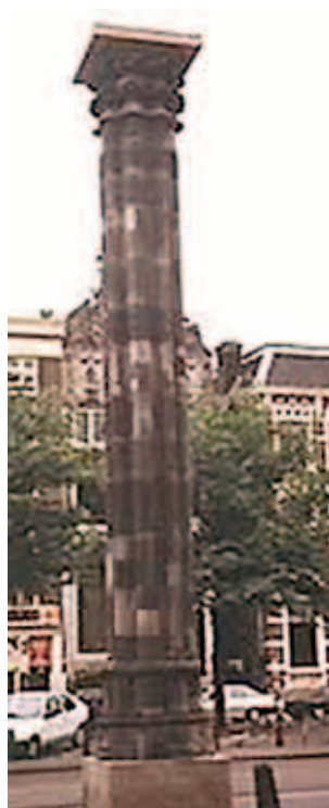
Cột đá còn sót lại sau đám cháy trong nhà thờ