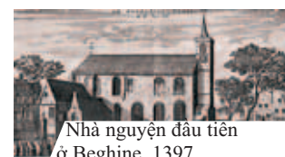
Nhà nguyện đầu tiên ở Beghine, 1397