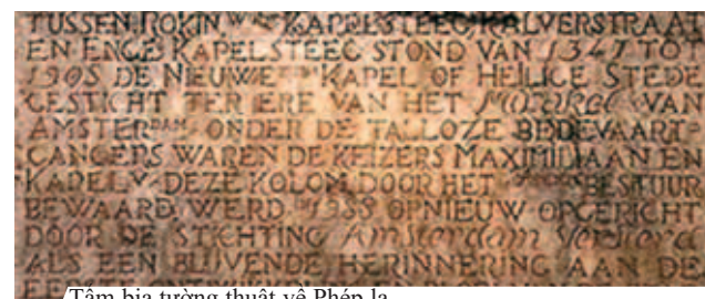
Tấm bia tường thuật về Phép lạ