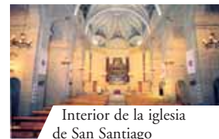
Interior de la iglesia de San Santiago