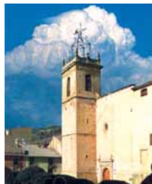
Iglesia de San Santiago Apóstol en Onil, donde se conserva la Hostia Milagrosa