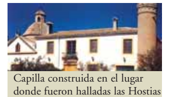
Capilla construida en el lugar donde fueron halladas las Hostias