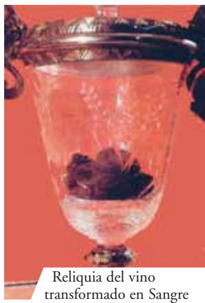
Reliquia del vino transformado en Sangre