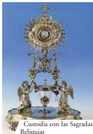
Custodia con las Sagradas Reliquias

En la iglesia de San Francisco, un grabado en mármol del siglo XVII describe este Milagro Eucarístico ocurrido en Lanciano en el año 750. “Un monje sacerdote dudaba de la presencia real del Cuerpo del Señor en la Hostia consagrada. Mientras celebraba la Misa y decía las palabras de la consagración, vio que la Hostia se convertía en Carne y el vino en Sangre. Todo fue mostrado a los presentes. La Carne está aún entera y la Sangre se presenta dividida en cinco partes desiguales que pesadas singularmente, obtienen el mismo peso que pesadas todas juntas”.