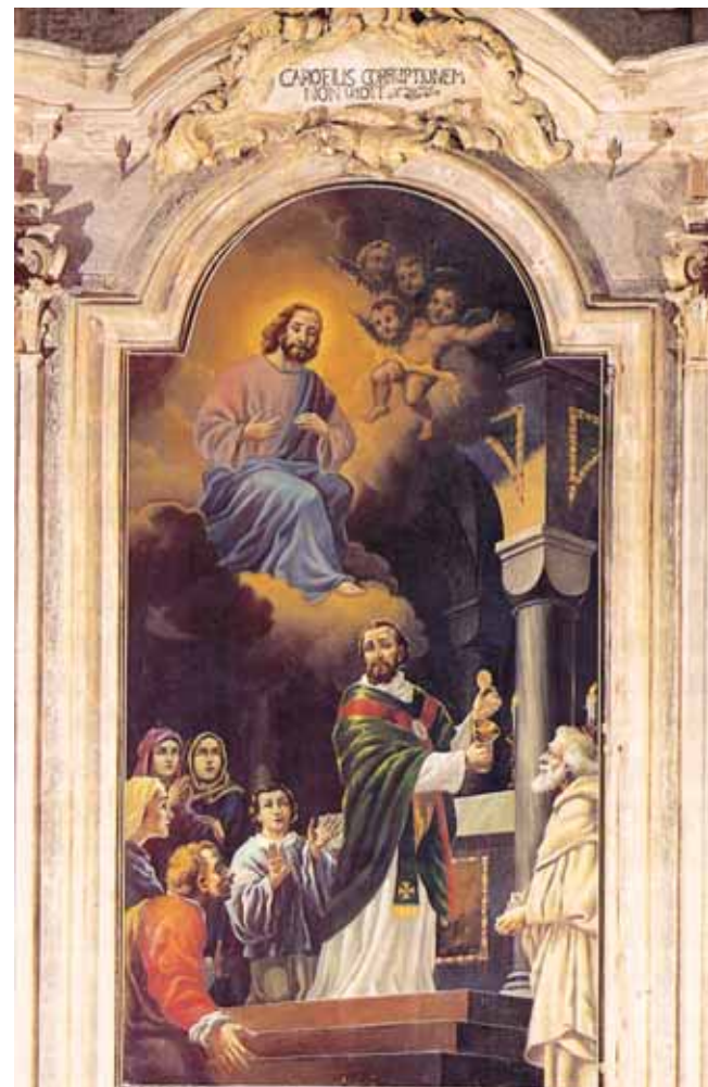
Pintura presente en la capilla Valsecca con la representación del Milagro