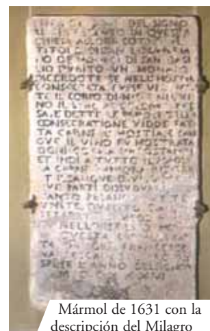
Mármol de 1631 con la descripción del Milagro