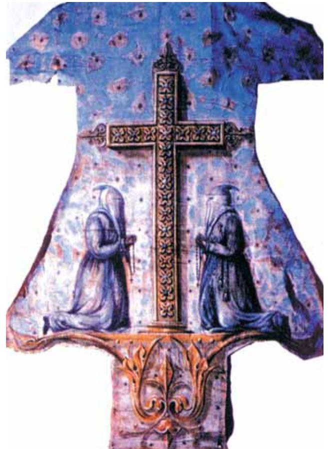
Hábito de los penitentes grises