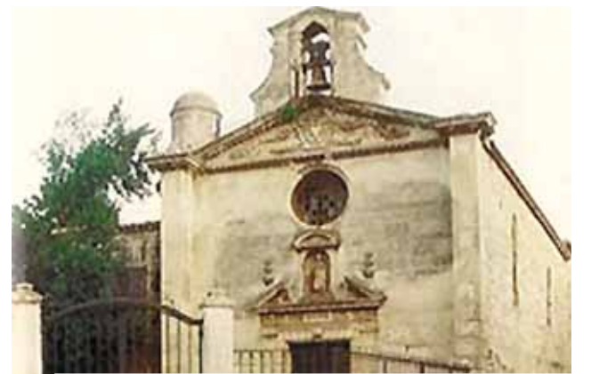
Fachada de la Capilla de los Penitentes Grises