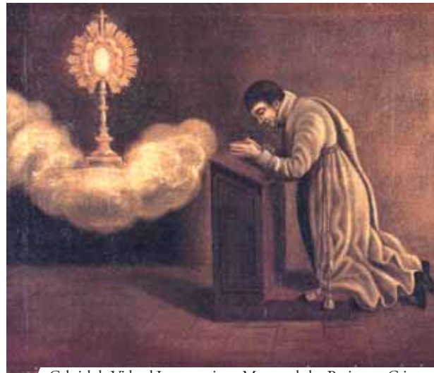
Gabriel de Vidaud Latour, primer Maestro de los Penitentes Grises

La noticia del Milagro se difundió rápidamente y todo el pueblo y las autoridades acudieron al lugar entonando cántos de alabanza y de agradecimiento al Señor