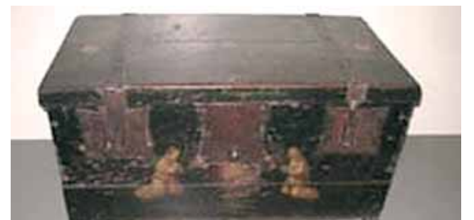
Cajón que contenía la Hostia Milagrosa.

E l 12 de marzo de 1345, pocos días antes de la Pascua, Ysbrand Dommer, mandó llamar a un sacerdote porque se encontraba al borde de la muerte. Después de haber comulgado, vomitó todo en una vasija, cuyo contenido fue inmediatamente arrojado al fuego de la chimenea. Al día siguiente, Ysbrand se había recuperado completamente. Una de las domésticas que lo servían se acercó a la chimenea para encender el fuego y notó una extraña luz que irradiaba de una Hostia. La mujer llamó la atención a todo el barrio con sus gritos. Así, muchos pudieron verificar el Milagro. Mientras tanto, Ysbrand pudo recuperar la Hostia. La envolvió en un paño de lino y la depositó en una pequeña caja para llevarla al párroco. Pero el Milagro continuó porque por tres veces el sacerdote tuvo que volver a la casa del enfermo para recuperar la Hostia que milagrosa-