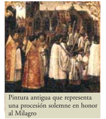
Pintura antigua que representa una procesión solemne en honor al Milagro