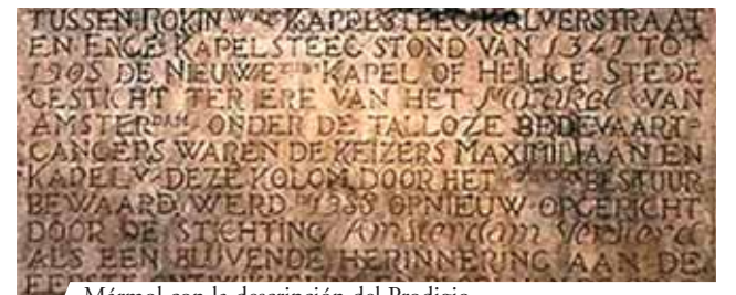
Mármol con la descripción del Prodigio