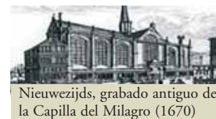
Nieuwezijds, grabado antiguo de la Capilla del Milagro (1670)