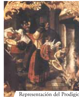
Representación del Prodigio