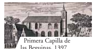
Primera Capilla de las Beguinas, 1397