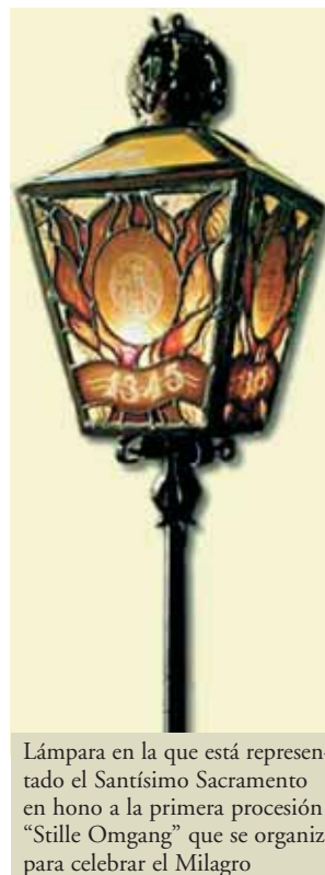
Lámpara en la que está representado el Santísimo Sacramento en hono a la primera procesión "Stille Omgang" que se organiza para celebrar el Milagro