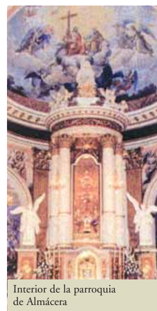
Interior de la parroquia de Almácer