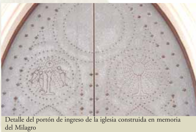
Detalle del portón de ingreso de la iglesia construida en memoria del Milagro