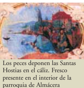
Los peces deponen las Santas Hostias en el cáliz. Fresco presente en el interior de la parroquia de Almácer