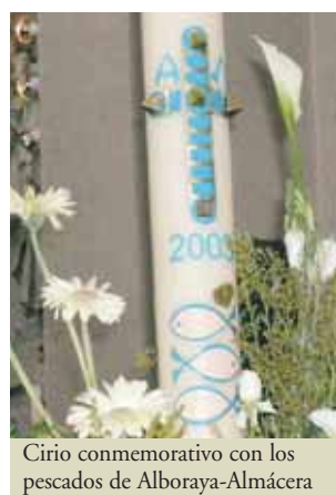
Cirio conmemorativo con los pescados de Alboraya-Almácer