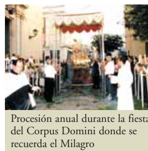
Procesión anual durante la fiesta del Corpus Domini donde se recuerda el Milagro