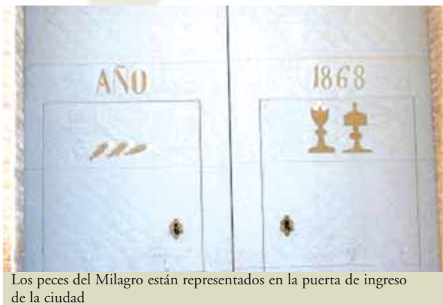
Los peces del Milagro están representados en la puerta de ingreso de la ciudad