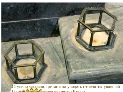
Ступени часовни, где можно увидеть отпечаток упавшей Гостии и оставленное ею пятно Крови