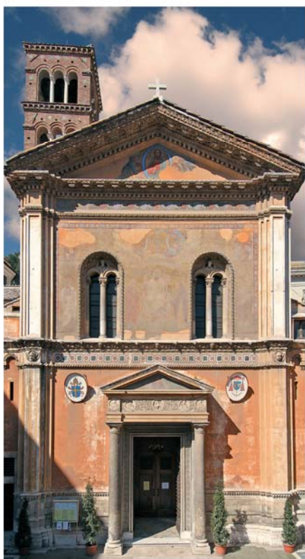
Церковь Санта-Пуденциана, Рим