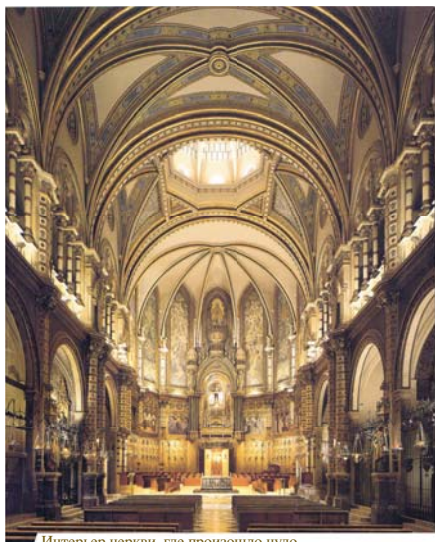
Интерьер церкви, где произошло чудо