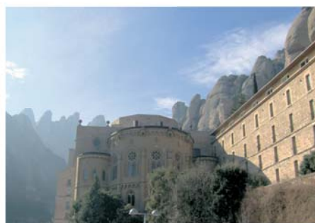
Храм Мадонны Монтсеррат