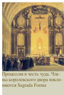
Процессия в честь чуда. Члены королевского двора поклоняются Sagrada Forma