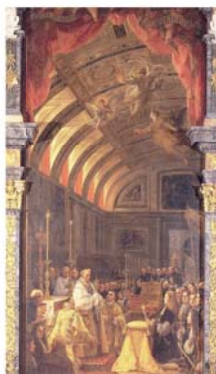
Картина Клаудио Коэлло, выполненная по заказу Карлоса II