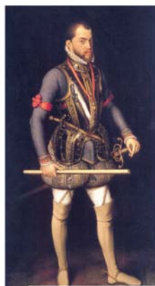
Король Филипп II