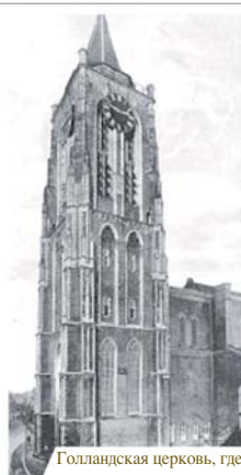
Голландская церковь, где произошло чудо