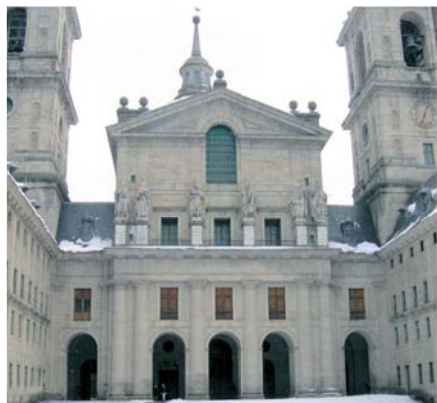
Внутренний двор церкви Королевского монастыря Escorial