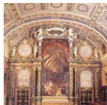
Алтарь, где хранится картина с изображением Sagrada Forma