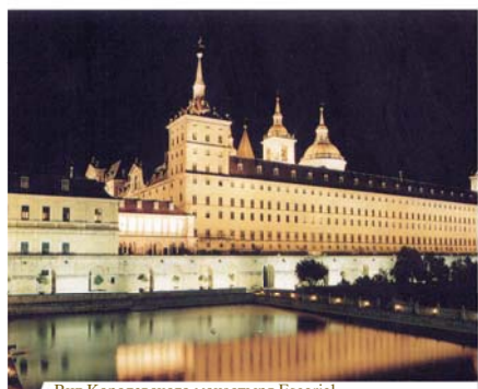
Вид Королевского монастыря Escorial