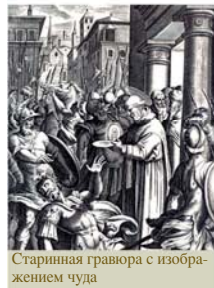
Старинная гравюра с изображением чуда