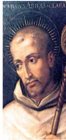
Портретное изображение св. Бернара