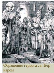
Обращение герцога св. Бернаром

Св. Бернар был главным действующим лицом важного евхаристического чуда. Герцог Аквитанский порвал с Католической Церковью и не собирался возвращаться в ее лоно. Св. Бернар, отслужив Мессу, явил герцогу Святое Причастие. Потрясенный таинственной силой, герцог упал на колени, умоляя просить его за то, что он отпал от Церкви.