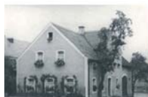
Родной дом Терезы