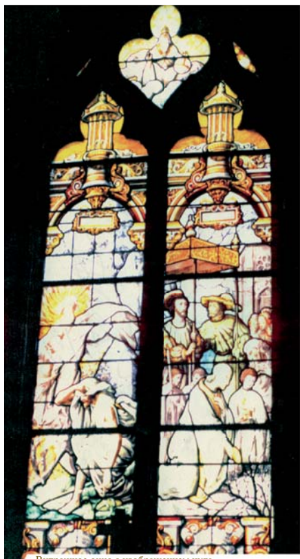
Витражное окно с изображением чуда