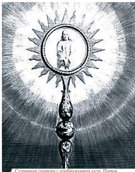
Старинная гравюра с изображением чуда, Париж