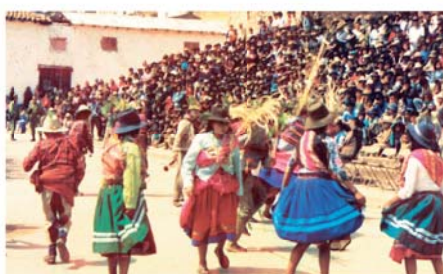
Праздник в честь Божественного Младенца