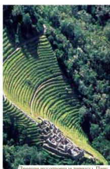
Древние рукотворные террасы, Перу