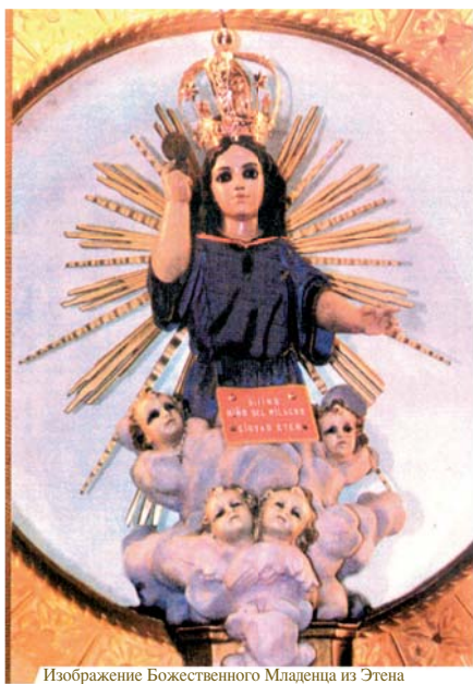
Изображение Божественного Младенца из Этены