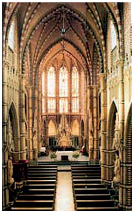
Интерьер церкви святого Трудо