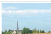
Панорамный вид базилики