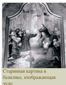
Старинная картина в базилике, изображающая чудо