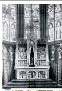
Алтарь, где совершилось чудо