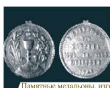
Памятные медальоны, изготовленные в честь чуда

В 1222 и в 1465 годах в городе Мерссен произошли два важных евхаристических чуда. Первое из них случилось во время Мессы, когда из большой Гостии истекли капли живой Крови, оставив пятна на корпорале. В 1465 году крестьянин сумел спасти чудесную святыню из огня, разрушившего всю церковь. Позже церковь была отстроена заново, а в 1938 году папа Пий XI присвоил ей канонический статус малой базилики. Ежегодно в Мерссен приходят многочисленные паломники, желающие поклониться святой реликвии.