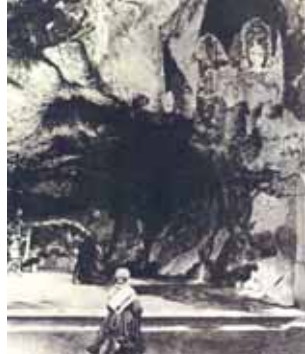
Uma das mais antigas fotografias de Bernardete na Gruta (1864)