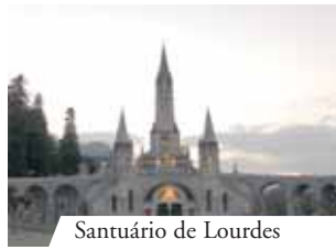
Santuário de Lourdes

Quando um sacerdote francês da Peregrinação Nacional propôs em 1888 realizar uma procissão com o Santíssimo Sacramento em Lourdes, ocorreu uma cura prodigiosa. Desde então, os doentes que vão a Lourdes em peregrinação são abençoados com o Santíssimo Sacramento e são incalculáveis as curas milagrosas ocorridas durante a passagem do Santíssimo. O Santuário de Lourdes é um exemplo luminoso da fé na presença real de Jesus na Eucaristia.