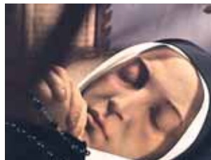
O corpo incorrupto de Santa Bernardete na Casa Madre das Irmãs da Caridade em Nevers