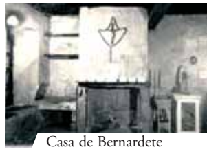
Casa de Bernardete