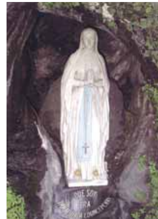
Estátua de Nossa Senhora na Gruta onde apareceu a Bernardete