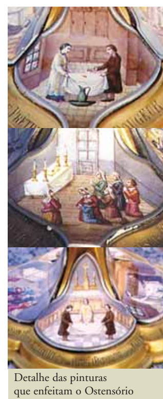
Detalhe das pinturas que enfeitam o Ostensório