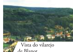
Vista do vilarejo de Blanot