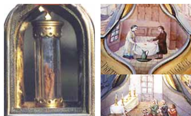
A Teca do século XVII com o tecido manchado de sangue se conserva num tubo de cristal em Blanot