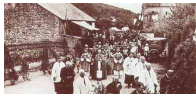
Procissão em homenagem ao Milagre