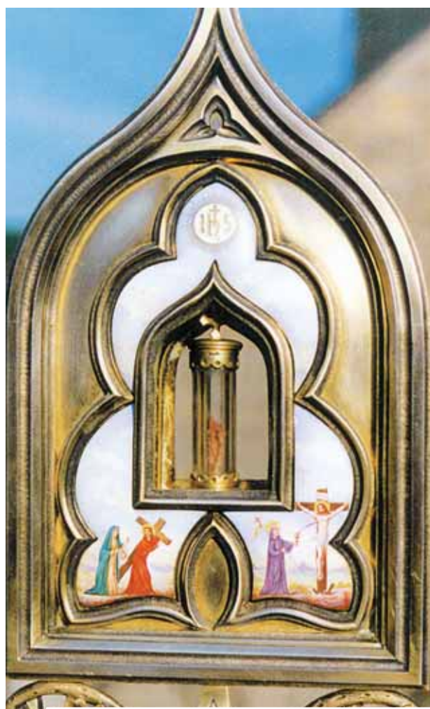
Ostensório com a Relíquia do Prodígio

No Milagre Eucarístico de Blanot, durante a Missa de Páscoa do ano de 1331, no momento da Comunhão, o sacerdote, sem querer, deixou cair um pedacinho de Hóstia sobre a toalha. O pároco quis imediatamente recolhê-lo, mas foi impossível, o fragmento tinha se transformado em Sangue e deixou uma mancha espessa na toalha. Até hoje no vilarejo de Blanot se conserva a Relíquia da toalha manchada de Sangue.