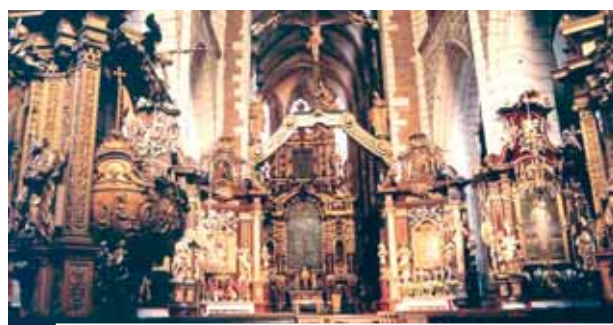
Interior da Igreja do Corpo de Deus, Cracóvia