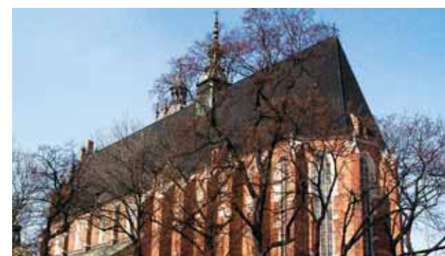
Igreja do Corpo de Deus, Cracóvia

No ano de 1345, o então rei da Polónia, Casimiro III o Grande, dá ordem para construir uma igreja intitulada de Corpo de Deus, em honra de um Milagre Eucarístico que se verificou no mesmo ano nos campos de Wavel vizinhos de Cracóvia.