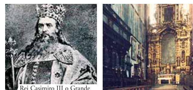
Rei Casimiro III o Grande