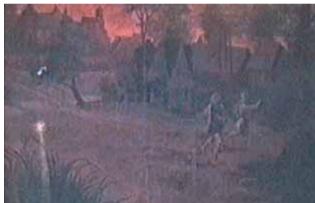
Quadro presente na Igreja do Corpo de Deus no qual está representado o fenómeno dos clarões luminosos provenientes do pântano

O Milagre Eucarístico de Cracóvia diz respeito à preservação das Hóstias, do lodo, e da aparição de estranhos fenómenos luminosos. Ladrões desconhecidos roubaram uma custódia contendo Partículas Consagradas, que abandonaram depois nos pântanos, nos arredores de Wavel. Na Igreja do Corpo de Deus em Cracóvia são ainda visíveis as pinturas que descrevem o Prodígio e documentos e os testemunhos do tempo.