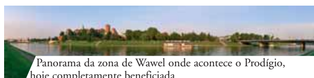
Panorama da zona de Wavel onde acontece o Prodígio, hoje completamente beneficiada