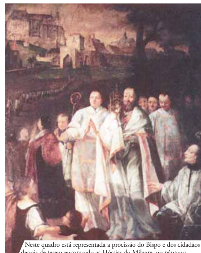
Neste quadro está representada a procissão do Bispo e dos cidadãos depois de terem encontrado as Hóstias do Milagre, no pântano

unanimemente advertir o Bispo de Cracóvia do acontecido. O Prelado, não compreendendo como podia acontecer que do pântano exalasses lampejos de luz tão intensos, tanto que eram visíveis por quilómetros, ordenou três dias de jejum e oração. Ao terceiro dia toda a aldeia se dirigiu em procissão, com o Bispo à cabeça, para o lugar do pântano luminoso. Revistou-se por toda a parte e finalmente um homem recuperou a custódia com as Hóstias dentro, as quais estavam completamente intactas e emanavam uma luz deslumbrante. O povo comovido começou a louvar o Senhor e a festejar o Prodígio. Ainda hoje, por ocasião da festa do Corpo de Deus, todos os anos se recorda o Milagre, na Igreja do Corpo de Deus, em Cracóvia.