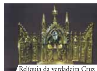
Relíquia da verdadeira Cruz