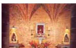
Santuário do Santo Sangue, Capela das Relíquias