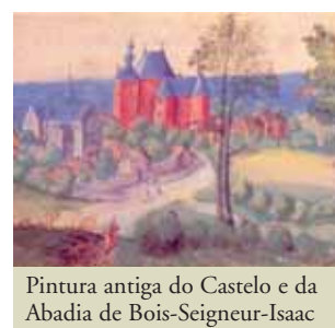
Pintura antiga do Castelo e da Abadia de Bois-Seigneur-Isaac