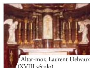
Altar-mor, Laurent Delvaux (XVIII século)