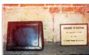
Pedra do altar, na qual o Cura de Haut-Ittre celebrou a Santa Missa onde se verificou o Milagre