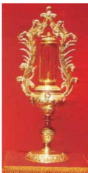
Relíquia de um espinho da coroa de Jesus