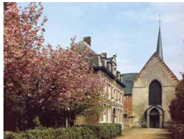
Abadia Premostratense, Capela do Santo Sangue