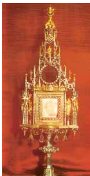
Relíquia do Milagre Eucarístico, o Corporal manchado de Sangue