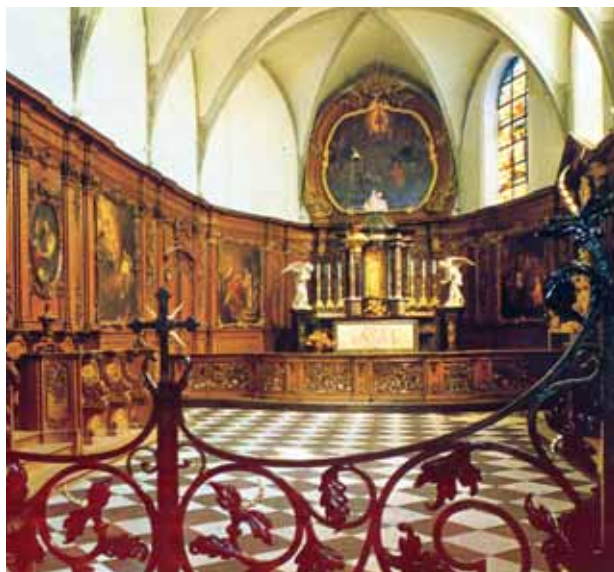
Coro da Capela do Santo Sangue

No Milagre Eucarístico de Bois-Seigneur-Isaac, a Hóstia Consagrada sangrou e manchou o Corporal da Missa. A 3 de Maio de 1413, o Bispo de Cambrai, Pedro de Ailly, autorizou o culto desta Sagrada Relíquia do Milagre. A primeira procissão fez-se em 1414. A 13 de Janeiro de 1424, o Papa Martino V, aprovou oficialmente a construção do Mosteiro de Bois-Seigneur-Isaac. Ainda hoje, o Mosteiro é meta de peregrinação, e na sua Capela é possível venerar a Sagrada Relíquia do Corporal manchado de Sangue.