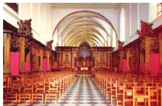
Interior da Capela do Santo Sangue