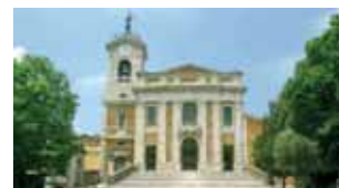
Catedral de S. Paulo de Alatri.