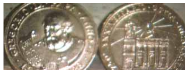
Em 1978 celebrou-se solenemente o 750º aniversário do Prodígio. Para a ocasião foi cunhada uma medalha que apresenta na frente uma imagem do Papa Gregório IX com a Bula, e no verso a fachada da Catedral com a Hóstia por cima.