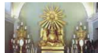
Capela onde está exposta a Hóstia Consagrada.