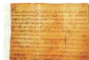
Bula "Fraternitas tuae" do Papa Gregório IX.