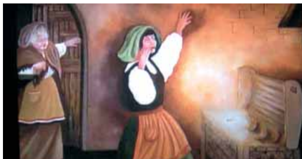
Quadros presentes na Catedral de Alatri que ilustram as várias fases do Prodígio.

Trata-se de um fragmento de Partícula convertida em verdadeira Carne. Uma jovem senhora para reconquistar o amor do seu noivo, dirigiu-se a uma feiticeira que, com o fim de lhe preparar um filtro de amor, lhe ordenou que roubasse uma Hóstia Consagrada. Durante uma missa, a jovem consegue tirar uma Hóstia que logo esconde no interior de um pano, mas, chegada a casa, apercebe-se que a Hóstia se transformou em Carne Ensanguentada. Deste Prodígio nos falam numerosos documentos entre os quais a Bula de Papa Gregório IX.