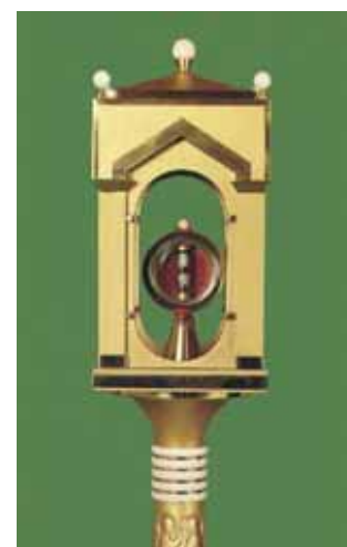
Relicário onde se guarda a Relíquia Milagrosa.