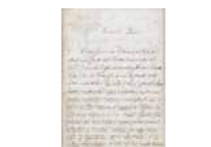
Carta do reitor de S. Maria in Terme, de 22 de Março de 1888, na qual agradece pela dádiva de parte da relíquia da Hóstia Consagrada conservada em Alatri.