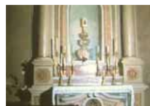
Capela no interior da Catedral onde se guarda a relíquia do Milagre.