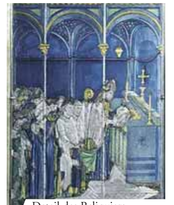
Detail des Reliquars