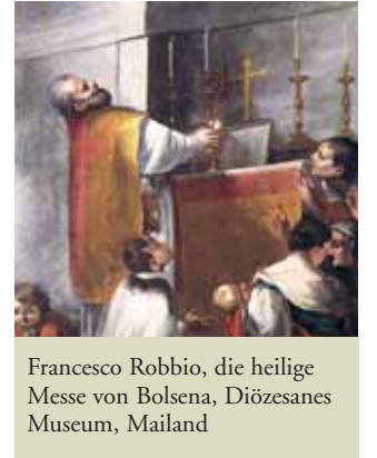
Francesco Robbio, die heilige Messe von Bolsena, Diözesanes Museum, Mailand