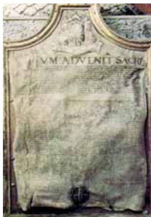
Zeitgenössische Urkunde über das Wunder