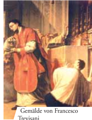
Gemälde von Francesco Trevisani