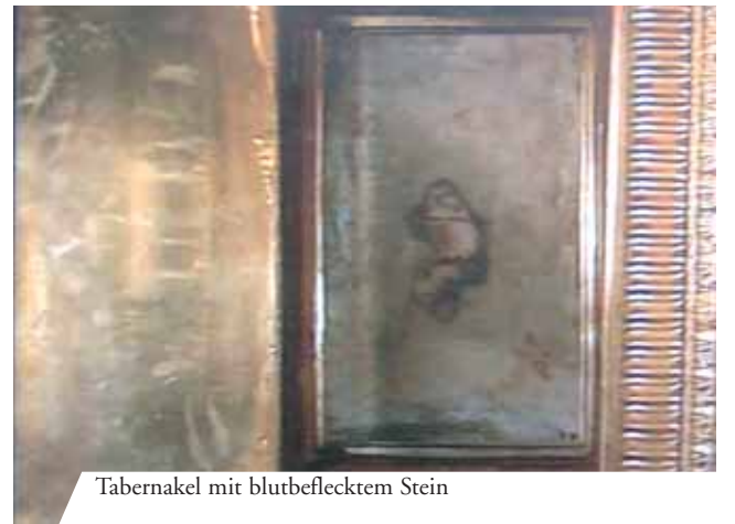
Tabernakel mit blutbeflecktem Stein