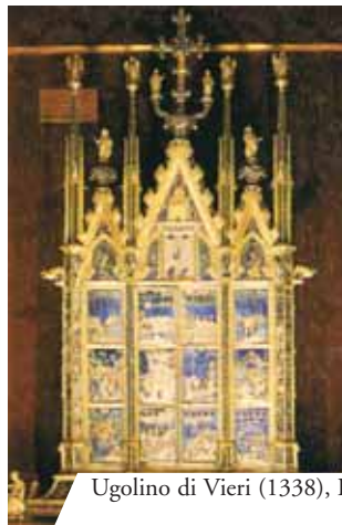
Ugolino di Vieri (1338), Reliquiar, Orvieto