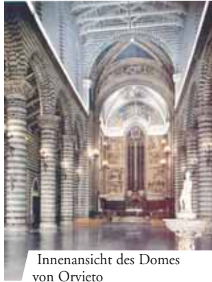
Innenansicht des Domes von Orvieto