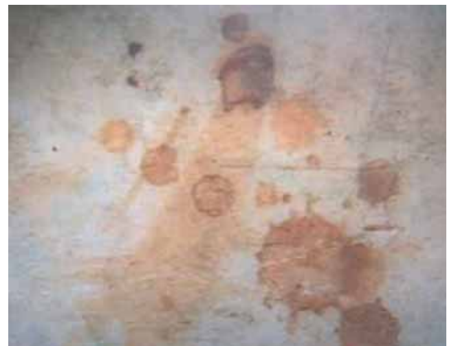
Detail des Steines