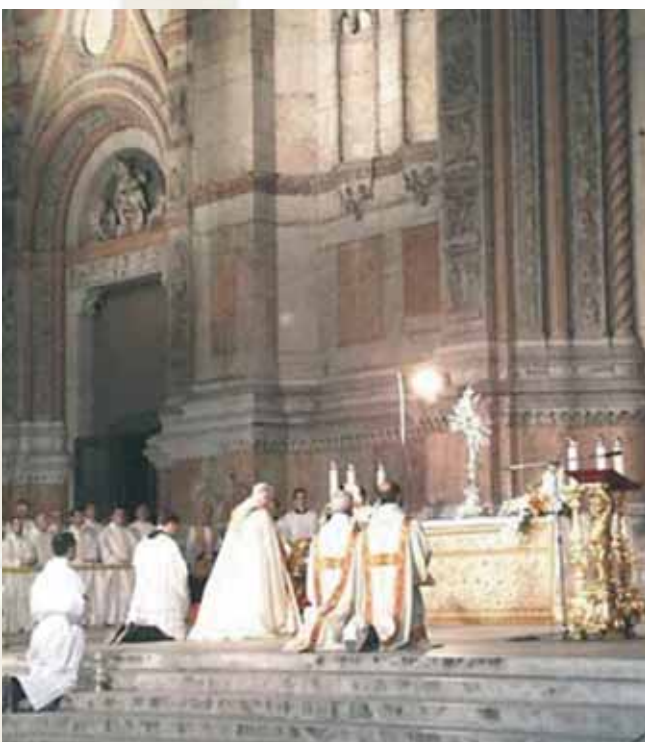
Verehrung zum Fronleichnamfest, Orvieto