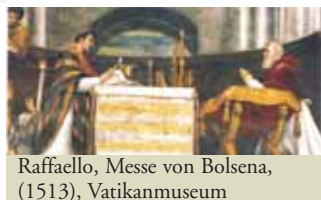
Raffaello, Messe von Bolsena, (1513), Vatikanmuseum