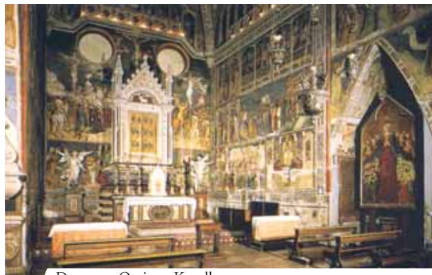
Dom von Orvieto, Kapelle