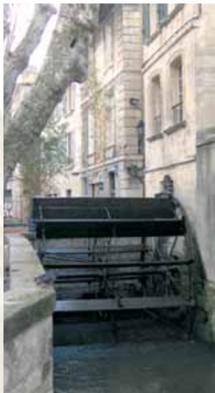
Kanal der neben der Kirche fließt