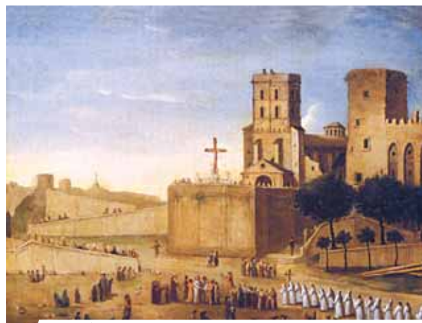
Papstpalast von Avignon