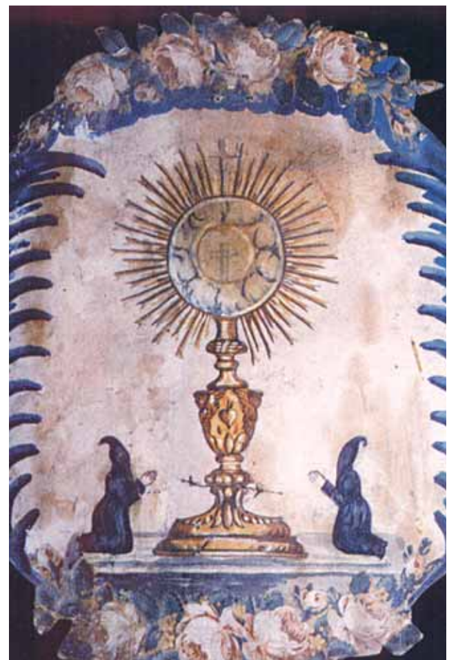
Freske in der Kapelle