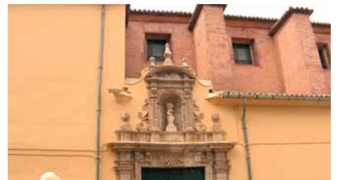
Église où a eu lieu le Miracle