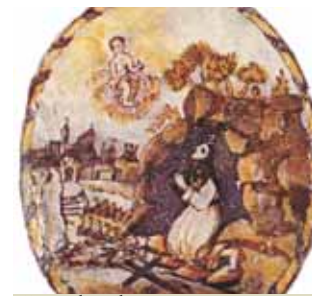
Inès, dans la grotte où elle vécut en ermite