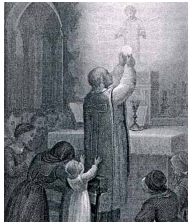
Gravure ancienne représentant le Miracle

L'élection du Pape Urbain VI (18 avril 1378) fut durement contestée par les Cardinaux français dans l'espoir de transférer à nouveau le siège papal d'Avignon. Après de nombreuses péripéties, le 20 septembre 1378, ils élirent l'antipape Clément VII. Les cardinaux schismatiques tentèrent aussitôt de s'emparer de Rome, avec l'emploi des armes, mais sans succès et se retirèrent à Avignon où Clément VII continua à agir comme s'il était le Pape légitime. Pendant cette période de grandes incertitudes, un prêtre de Moncada, Mosén Jaime Carros, vivait un tourment : son Ordination sacerdotale était valable ou non, vu qu'il avait été consacré par un Évêque nommé par l'antipape Clément VII. Chaque fois qu'il disait la Messe, il était assailli par la terreur de tromper les fidèles et de distribuer des Hosties non consacrées ; il craignait aussi que tous les autres Sacrements