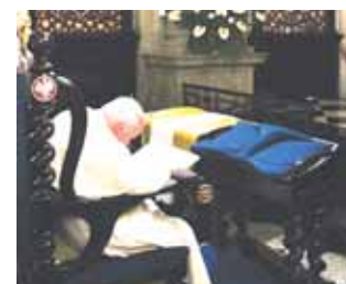
Jean Paul II a institué en l'an 2000 la fête liturgique de la Divine Miséricorde qui est célébrée chaque année le premier dimanche après Pâques

Jésus à Sainte Faustine : « Ma fille, aide-moi à sauver un pécheur en agonie : récite pour lui le chapelet que je t'ai appris ». Quand je commençai à réciter le chapelet, je vis le moribond lutter et souffrir atrocement. Il était défendu par son ange gardien presque impuissant devant la grande misère de cette âme. Une multitude de démons l'attendait, mais tandis que je récitais le chapelet, je vis Jésus avec l'aspect dans lequel il est peint sur l'image. Les rayons qui sortaient de son Cœur entourèrent le malade et les puissances du mal s'enfuirent en provoquant un grand désordre. Le malade mourut paisiblement. Quand je repris mes esprits, je compris l'importance de ce chapelet au chevet des mourants, pour calmer la colère de Dieu ». (Sainte Faustine Kowalska, Journal, Librairie Editrice Vaticana, page 515)