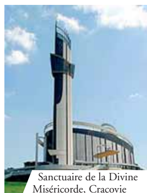
Sanctuaire de la Divine Miséricorde, Cracovie