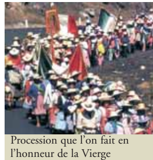
Procession que l'on fait en l'honneur de la Vierge