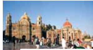
Ancienne Basilique de Guadalupe