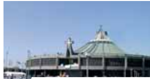
Nouveau Sanctuaire de Guadalupe

La base historique indiscutable de l'Eucharistie est l'incarnation du Fils de Dieu. « La chair du Christ, la chair de Marie », dit Saint Augustin. L'Église « en Marie contemple avec joie, comme en une très pure image, ce qu'elle désire et espère être dans son intégrité » (SC, 103) : tabernacle, sein maternel, ostensor. La Sainte Vierge est apparue à Guadalupe habillée avec une robe serrée à la taille par une ceinture noire identique à celle que portaient les femmes enceintes selon les coutumes locales.