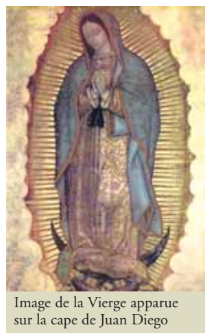
Image de la Vierge apparue sur la cape de Juan Diego