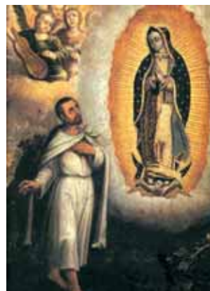
Peintures anciennes représentant Juan Diego et la Sainte Vierge