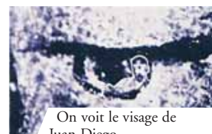
On voit le visage de Juan Diego

A l'aube du 9 décembre 1531, un jeune Indien, Juan Diego, monta sur le col du Tapeyac, à la banlieue nord de Mexico, en se dirigeant vers Tlatelolco, pour son habituelle leçon de catéchisme. Tout à coup il entendit un chant suave et se dirigea vers l'endroit d'où provenait ce son. Il arriva devant une jeune femme avec une robe resplendissante qui lui révéla être la Vierge Marie. Elle pria Juan Diego de demander à l'Évêque de faire construire un temple là où elle avait apparu, afin que tout le monde puisse honorer son Fils Jésus. Il obéit, mais l'Évêque Juan de Zumarraga ne le crut pas et lui dit de demander un signe à la Sainte Vierge. Quand elle apparut pour la troisième fois à Juan Diego, elle lui promit de lui donner le signe demandé le lendemain. Le lundi suivant Juan Diego n'alla pas au rendez-vous à cause d'une maladie de son