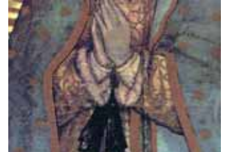
La ceinture indique la grossesse de la Vierge. Elle est placée sur le ventre. La forme de la ceinture, dans le monde nahuatl, représentait la fin d'un cycle et la naissance d'une nouvelle époque. L'image de la Vierge de Guadalupe symbolise qu'avec Jésus-Christ commence une nouvelle époque, soit pour le vieux que pour le nouveau monde.