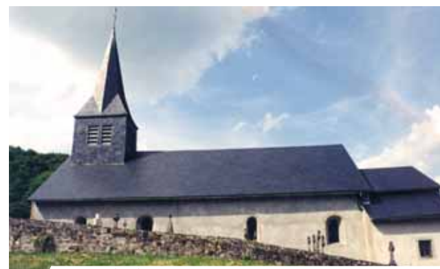
Paroisse de Blanot