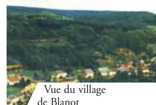
Vue du village de Blanot