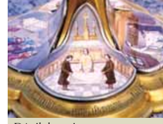
Détail des peintures qui ornent l'ostensor