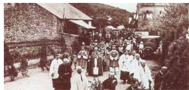
Procession en l'honneur du Miracle

A u XIV ème siècle Blanot était un petit village du centre de la France faisant partie du diocèse d'Autun. L'Évêque de cette ville, Pierre Bertrand, fit faire une enquête canonique par son officiel de curie, Jean Jarossier, la même année pendant laquelle eut lieu le Miracle. Pour cette raison aujourd'hui on dispose d'un rapport détaillé des faits.