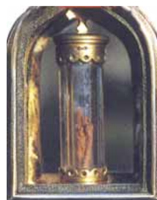
Châsse du XVII ème siècle qui contient le Tissu taché de Sang conservé dans un tube de cristal à Blanot