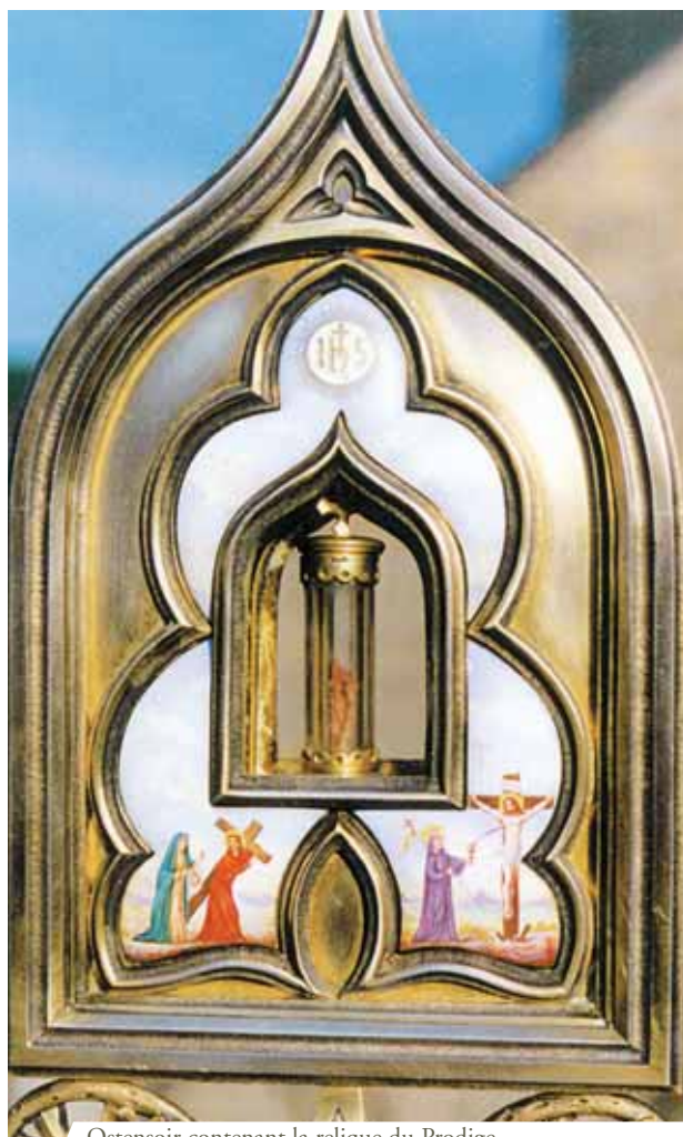
Ostensor contenant la relique du Prodigé

Pendant la Messe de Pâques 1331, au moment de la Communion, le prêtre par erreur, fit tomber sur la nappe un fragment de l'Hostie consacrée. Le Curé voulut tout de suite la récupérer, mais ce fut impossible, car le fragment de l'Hostie s'était transformé en Sang, formant une grosse tache sur la nappe. Encore aujourd'hui dans le village de Blanot on conserve la Relique de l'étoffe tachée.