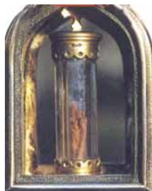
這塊沾了聖血的布放在水晶管中，再放在聖人遺物盒裡。目前保存在伯蘭諾，乃十七世紀之物。