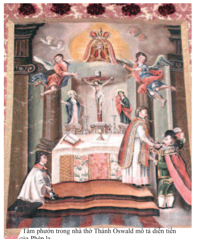
Tâm phước trong nhà thờ Thánh Oswald mô tả diễn tiến của Phép lạ

Tại một thành phố nhỏ thuộc nước Áo tên Seefeld, trong khi xem Lễ ngày Thứ năm Tuần thánh, Lãnh Chúa Schlosberg có tên là Oswarld Milser đã ao ước được rước một bánh thánh lớn như Bánh Thánh cha sở đang làm lễ. Ngay trong lúc ông ta sắp rước Lễ, thì tự nhiên sàn nhà dưới chân ông đứng bị rung động thật mạnh và đất bắt đầu nứt ra. Oswald cảm thấy như sắp bị hút sâu vào lòng đất, nên ông phải bám chặt vào bàn thờ để khỏi bị rơi vào kẻ nứt ấy. Và cha sở liền lấy lại Thánh Thể lớn mà Oswald đang còn ngậm trong miệng. Tức thì sự rung chuyển ngừng hẳn đi, và Máu bắt đầu rỉ ra từ Thánh Thể. Tin đồn vang cả nước, và Vua Maximilian I là người rất tôn sùng Thánh Thể. Chúng ta có thể chiêm ngắm Thánh Thể còn thấm Máu tại nhà thờ thánh Oswald ở Áo, và các bức tranh diễn tả Phép Lạ.