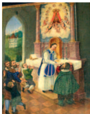
Tranh diễn tả Phép lạ Thánh Thể ở Seefeld, lưu giữ ở Elsbethenkapelle ad Hopfgarten