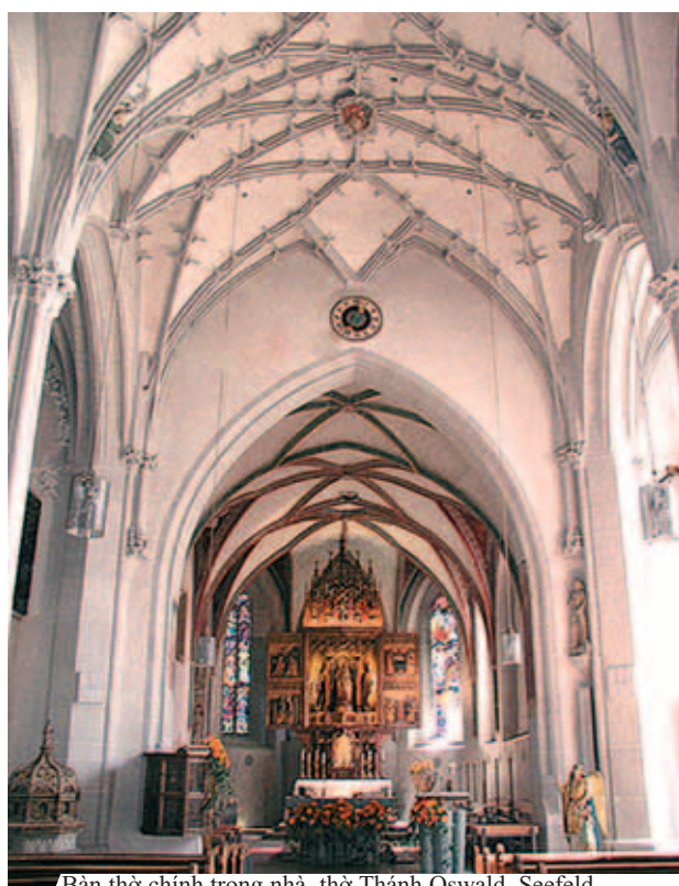
Bàn thờ chính trong nhà thờ Thánh Oswald, Seefeld.