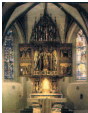
Bàn thờ nơi xảy ra Phép lạ