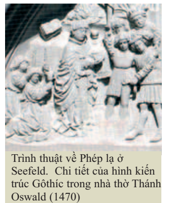
Trình thuật về Phép lạ ở Seefeld. Chi tiết của hình kiến trúc Gothic trong nhà thờ Thánh Oswald (1470)