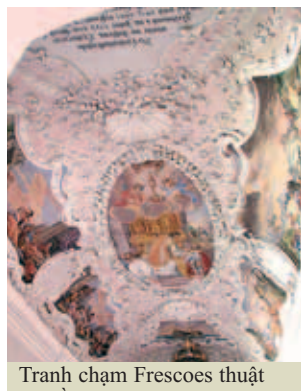
Tranh chạm Frescoes thuật lại về phép lạ