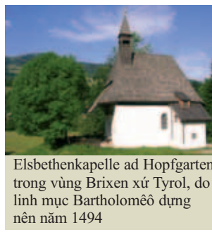
Elsbethenkapelle ad Hopfgarten trong vùng Brixen xứ Tyrol, do linh mục Bartholomêô dựng nên năm 1494