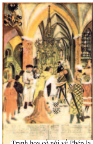
Tranh họa cổ nói về Phép lạ