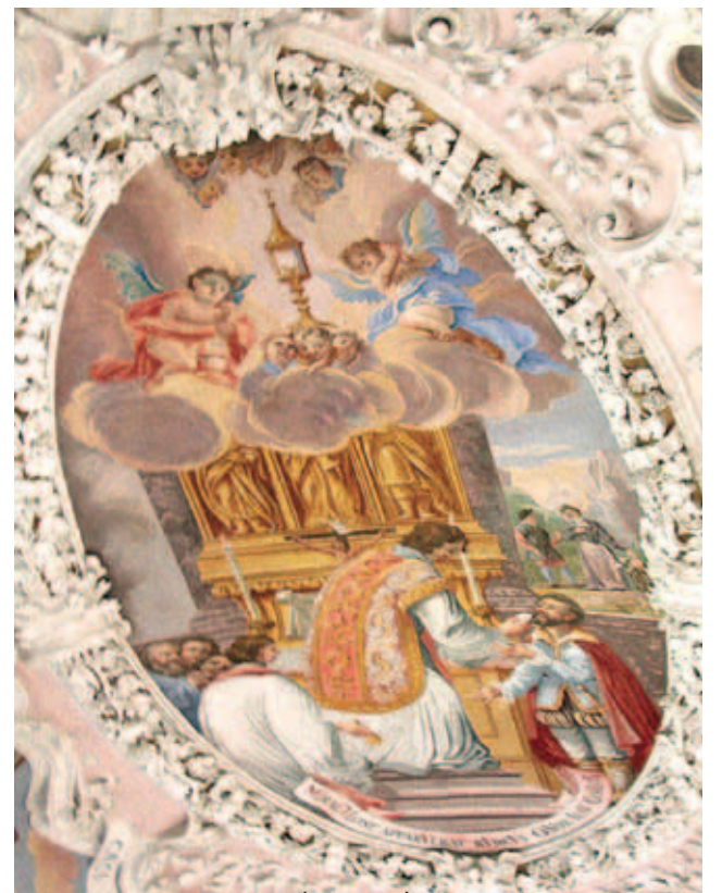
Phép lạ Seefeld. Chi tiết ở trên trần nhà thờ