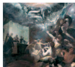
Thánh Gregoriô đã giải thoát được nhiều linh hồn khỏi luyện ngục nhờ vào Thánh lễ nhiệm màu