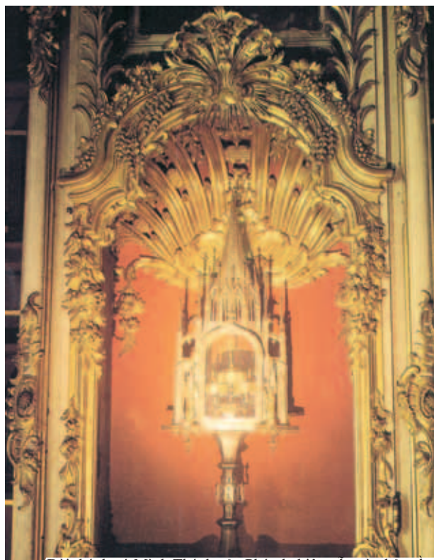
Đài thánh có Minh Thánh của Phép lạ hiện vẫn còn bảo tồn ở Andechs

Trong lúc làm Thánh Lễ Chủ nhật tại ngôi nhà thờ kính Thánh Phêrô, Đức Giáo hoàng cho rước Lễ, và ngài thấy người đàn bà làm bánh lễ đang đứng trong hàng mà còn cười lớn tiếng. Cảm thấy không đẹp lòng, ngài gọi bà qua một bên để chất vấn. Người đàn bà này nói vì không tin bánh lễ do chính tay mình làm có thể trở nên Mình và Máu Chúa trong khi truyền phép. Thánh Grêgoriô từ chối không cho bà ta rước Chúa, và cầu xin