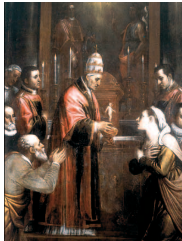
Thánh Lễ Nhiệm màu của Thánh Gregoriô Cả do Domenicò Cresti (1559 – 1638)