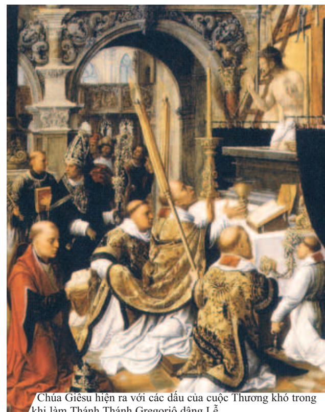
Chúa Giêsu hiện ra với các dấu của cuộc Thương khó trong khi làm Thánh Thánh Gregoriô dâng Lễ

Chúa soi sáng cho người phụ nữ này. Ngài vừa dứt lời cầu nguyện, thì phần Bánh Thánh do người đàn bà đã làm ra đã trở thành Máu Thịt. Người đàn bà hối hận, quỳ xuống và bắt đầu khóc. Cho đến hiện nay, thánh tích Phép lạ còn lưu giữ ở Andechs thuộc nước Đức, gần tu viện Dòng Biển Đức.