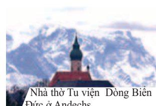
Nhà thờ Tu viện Dòng Biển Đức ở Andechs