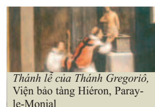
Thánh lễ của Thánh Gregoriô, Viện bảo tàng Hiéron, Paray-le-Monial