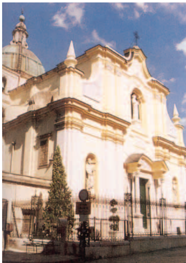
Nhà thờ Thánh Phêrô, Patierno

Ngày 29 tháng 8, 1774, Phụ Tá Đức Tổng giám mục đã tuyên bố công nhận Phép lạ những Thánh Thể thuộc nhà thờ Thánh Phêrô ở Patierno bị ăn cắp ngày 24 tháng 2, 1772 đã được tìm ra, và còn tồn tại cách diệu kỳ với thời gian. Vào năm 1971 Năm Thánh Thể của giáo phận được thiết lập để cộng đoàn có thể cảm nhận được ý nghĩa tinh tuyền của Phép Lạ Thánh Thể. Đáng tiếc là thánh tích có mang Mình Thánh nhiệm màu bị những tên trộm vô danh lấy mất năm 1972.