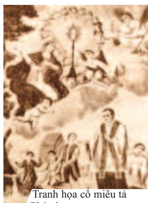
Tranh họa cổ miêu tả Phép lạ