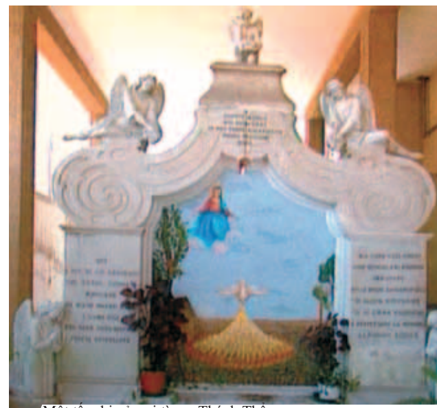
Một tấm bìa ở nơi tìm ra Thánh Thể