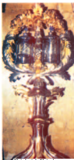
Thánh tích Phép lạ