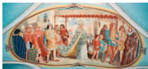
Tranh chạm fresco miêu tả cuộc rước kiệu ở Roma năm 1513, với Đức Giáo hoàng Lêô X mang Thánh tích Cực Trọng diễu qua các đường phố