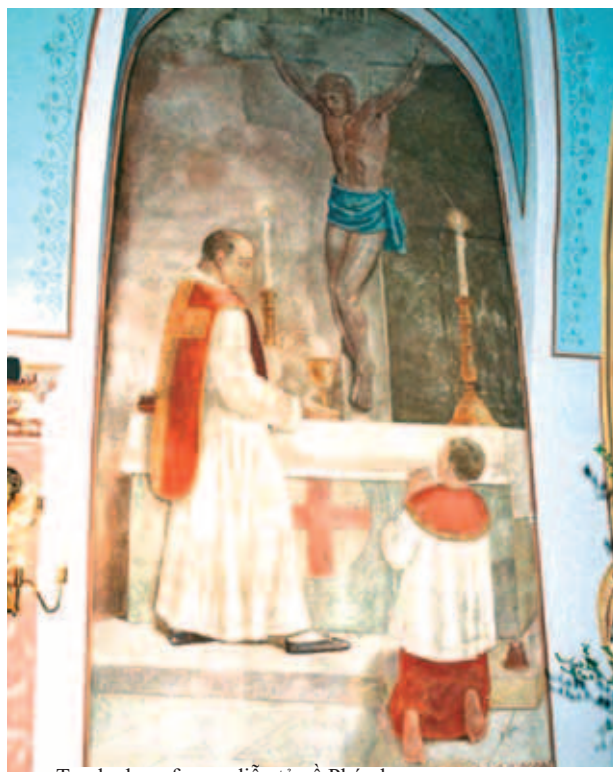
Tranh chạm fresco diễn tả về Phép lạ

Phép lạ đã xảy ra năm 1411 ở Ludbreg. Đang lúc cử hành Thánh lễ, trong khi nâng ly rượu lên và đọc lời truyền phép, trong lòng linh mục bỗng nhiên nổi lên ý tưởng hoài nghi đến màu nhiệm Thánh Thể, đến việc rượu biến thành Máu Chúa. Ngay giờ phút ấy, rượu trong ly đã biến thành Máu trước sự sững sốt của ngài. Ngày nay thánh tích Bửu huyết Cực Thánh đã hấp dẫn hàng ngàn khách hành hương, hàng năm đến dự lễ cử hành vào đầu tháng 9, nhân dịp cử hành lễ “Sveta Nedilja- Chủ nhật Thánh” kéo dài đến cả tuần lễ để kỷ niệm Phép lạ Thánh Thể năm 1411.