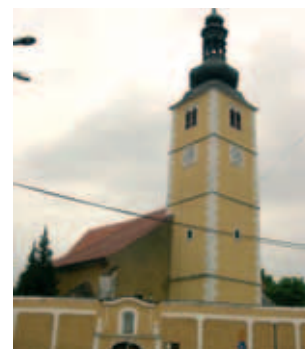
Nhà nguyện trong lâu đài của dòng họ Batthyany nơi có Phép lạ