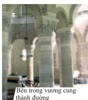
Bên trong vương cung thánh đường