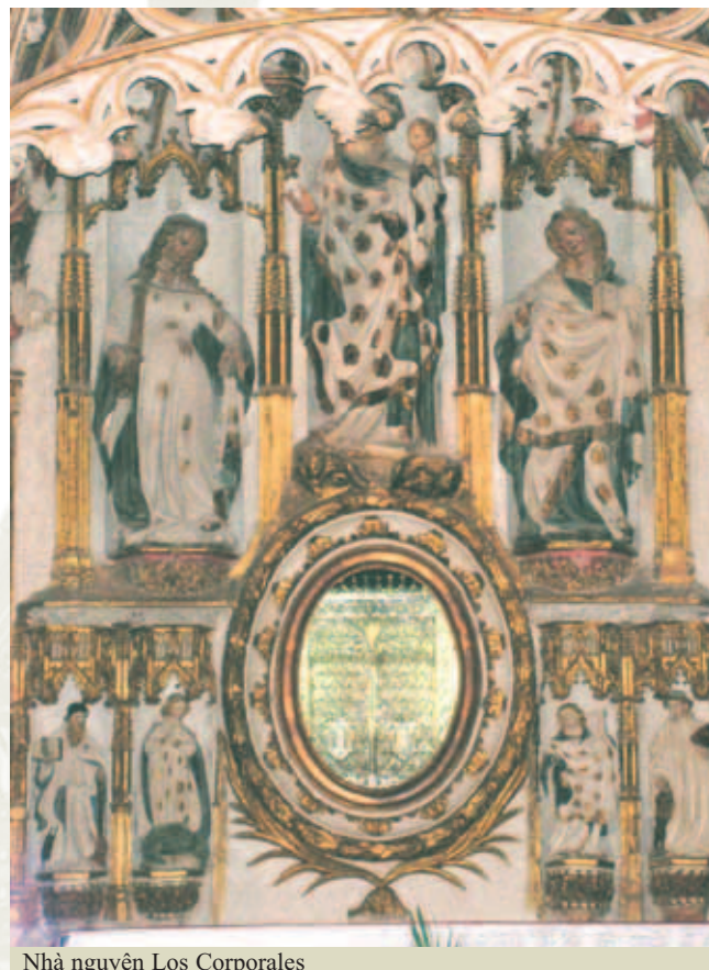
Nhà nguyện Los Corporales