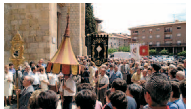
Kiệu cử hành trọng thể hàng năm để kỷ niệm Phép lạ Daroca