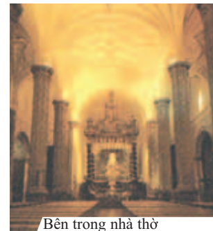
Bên trong nhà thờ