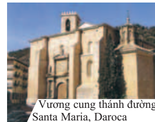
Vương cung thánh đường Santa Maria, Daroca