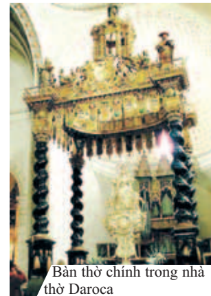
Bàn thờ chính trong nhà thờ Daroca