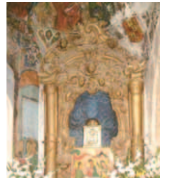
Nhà nguyện nơi còn lại tấm khăn thánh Hijuela, Carboneras