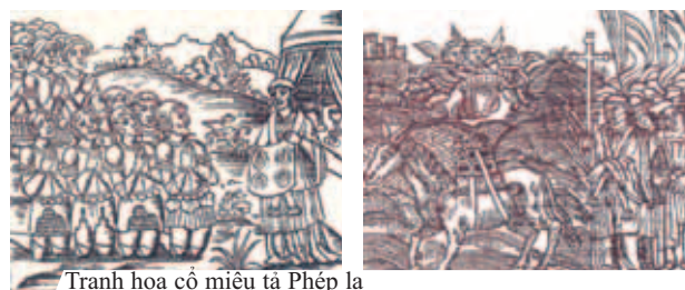
Tranh họa cổ miêu tả Phép lạ