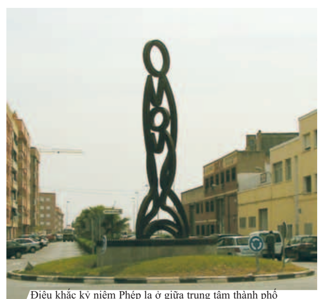
Điêu khắc kỷ niệm Phép lạ ở giữa trung tâm thành phố