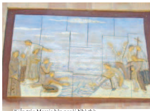
Kiến trúc Mosaic bên ngoài Nhà thờ