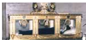
El cuerpo incorrupto de Santa Bernadette en la casa madre de las Religiosas de la Caridad en Nevers