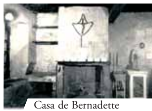
Casa de Bernadette