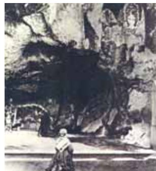
Una de las más antiguas fotografías de Bernadette en la gruta (1864)