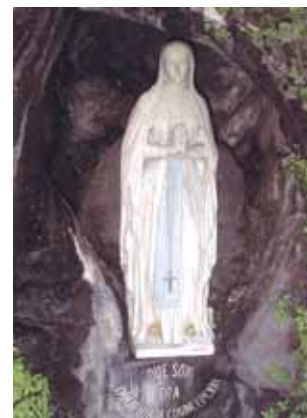
Estadua de la Virgen en la misma gruta donde se apareció ante Bernadette