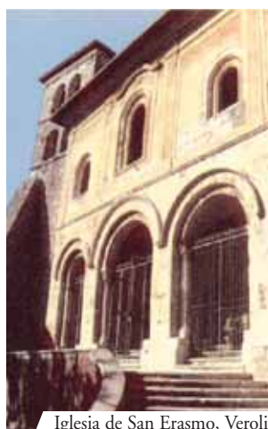
Iglesia de San Erasmo, Veroli