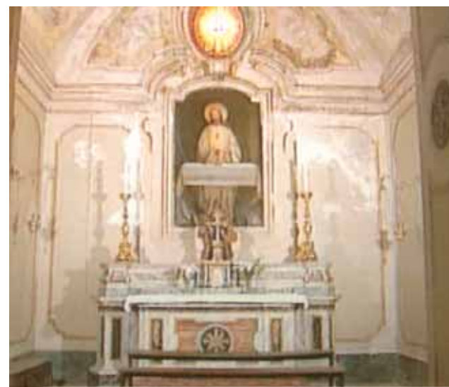
Capilla donde se dio lugar la prodigiosa aparición

E n la Pascua del año 1570, en la iglesia de San Erasmo, la Hostia consagrada, según el rito tradicional, fue depositada en una píside de plata de forma cilíndrica con tapa y cerradura que viene luego colocada en un gran cáliz ministerial, también de plata y cubierto por una patena. El conjunto viene luego envuelto en una elegante tela de seda. Es necesario precisar que en siglo XV, la exposición del Santísimo en la custodia era poco difundida aunque ya en el Concilio de Colonia (1452) se había hablado de este argumento. Era costumbre que cada confraternidad de la ciudad se organizase para hacer una hora de adoración delante del SS. Sacramento expuesto. Así, los miembros de la confraternidad de la Misericordia, que precedían a los del Corpus Domini y a los de la Virgen, vestidos con telas negras, se dispusieron a rezar de rodillas.