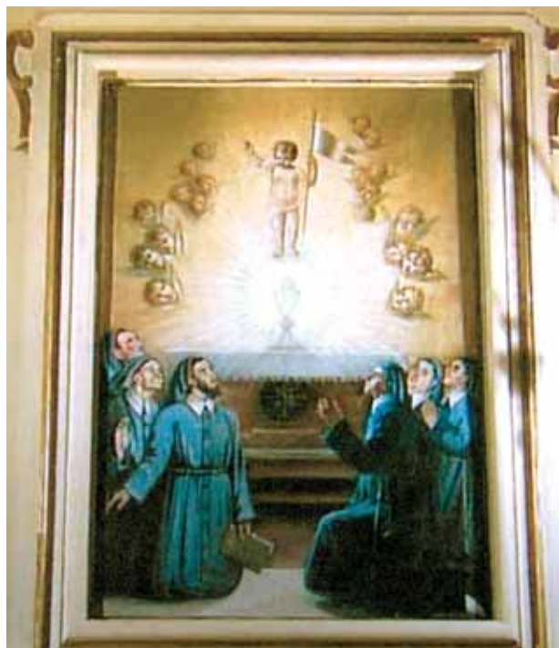
Pintura antigua con la representación del Milagro

En la Pascua del año 1570, en la iglesia de San Erasmo en Veroli sucedió un Prodigio durante la exposición del SS. Sacramento (que en aquellos tiempos era depositado en un recipiente cilíndrico que a su vez, se ponía dentro de un cáliz ministerial, cubierto por la patena), en la tradicional Cuarenta horas de adoración. Mientras los fieles oraban, el Niño Jesús apareció en la Hostia expuesta y, desde allí, obró numerosas gracias. Hoy, el cáliz donde fue expuesto el SS. Sacramento se conserva en la iglesia de San Erasmo y es utilizado para la celebración de la Santa Misa una vez al año, el martes después de la Pascua.