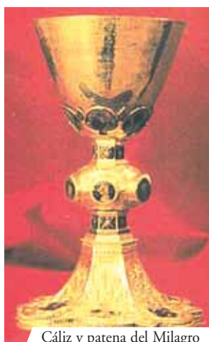
Cáliz y patena del Milagro