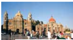
Basílica antigua de Guadalupe