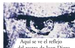
Aquí se ve el reflejo del rostro de Juan Diego

Al amanecer del 9 de diciembre de 1531, un joven indio llamado Juan Diego subió por las colinas del Tepeyac que quedaba a las afueras de la ciudad de Méjico. Se dirigía a Tlatelolco para sus clases de catecismo. De pronto, oyó un suave canto y se dirigió al lugar de donde provenía el sonido. Se encontró con una mujer joven que tenía resplandecientes vestidos. Ella le reveló ser la Virgen María. Luego, rogó a Juan Diego que fuese donde el Obispo de la capital para pedirle la construcción de un templo en el lugar donde ella se había aparecido para que todos pudiesen honrar a su Hijo Jesús. Juan Diego obedeció, pero el Obispo, Juan de Zumárraga, pidió una señal porque se mostraba incrédulo ante la narración. Cuando la Virgen apareció por tercera vez a Juan Diego, le prometió que le daría una señal al día siguiente. Pero ese día, un lunes, Juan Diego no