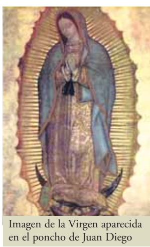
Imagen de la Virgen aparecida en el poncho de Juan Diego

El 6 de mayo de 1999, Juan Pablo II se dirigió en peregrinación a la imagen de la Virgen de Guadalupe