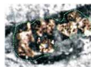
Ampliación de las imágenes presentes en los ojos de la Virgen