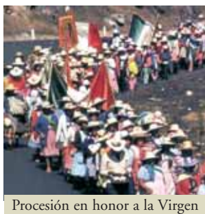
Procesión en honor a la Virgen