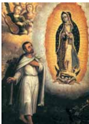
Pintura antigua de Juan Diego y la Virgen