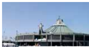
Nuevo Santuario de Guadalupe

La base indiscutiblemente histórica de la Eucaristía es la Encarnación del Hijo de Dios. “Carne de Cristo, carne de María”, dice San Agustín. La Iglesia “en María contempla con gozo, como a través de una imagen purísima, aquello que ella desea y espera ser en toda su integridad” (SC 103), es decir, tabernáculo, vientre, custodia. La Virgen se apareció en Guadalupe con una túnica ajustada a la cintura con un lazo negro, idéntico a la usanza típica de las mujeres en gestación.